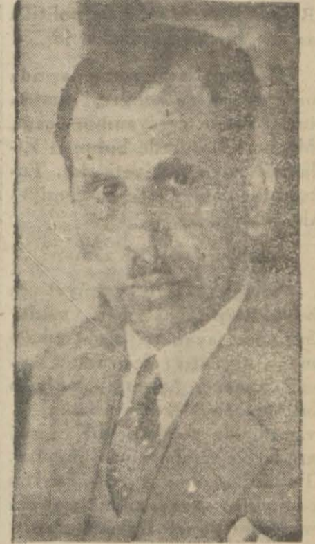
Kâzım Pş. Hz.

Meclis Reisi Kâzım Pş. Hz. dün öğleden sonra Dolmabahçe sarayındaki daire mahsusından çıkarak otomobile Beyoğlu cihetinde bir tenezzüh yapmıştır. Kâzım Pş. Hz. bugün Ankara'ya hareket edecektir.