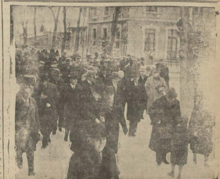
Başvekil İsmet Paşa Hazretlerinin Ankara'ya dönüşleri intibâhı.