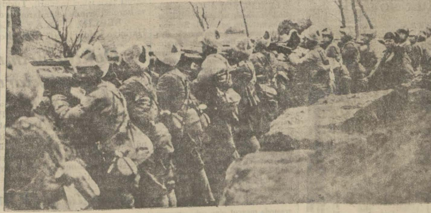
Ateş hattında Çinli askerler

Son kanun, himayeyi bir sistem olarak kabul etmesi itibariyle, büsbütün başka mahiyettedir. Ve İngilterede 1847 senesinden beri takip edilen iktisadî siyaseti tamamiyle tersine çeviriyor. İngilterenin, her memleket gibi, sanayiini himaye etme hakkı olduğu inkâr edilemez. Fakat bu hakkın istimalinde bir itirafı aciz olduğunun her İngilizin kabul etmesi lâzımdır. İngiltere, bütün 19 uncu asrın son nisfında dünyaya meydan okumuştur. Bu zaman zarfında da İngilizlerin serbest ticaretten ayrılmaya salâhiyetleri vardı. O halde o zaman neden serbest ticareti tatbik etmekte devam ettiler? Çünkü kendi sınaî ve ticarî kabiliyetlerine imtinaları vardı. Bu imtinalar o kadar büyüktü ki, İngilterede serbest ticaret, bir itirafı