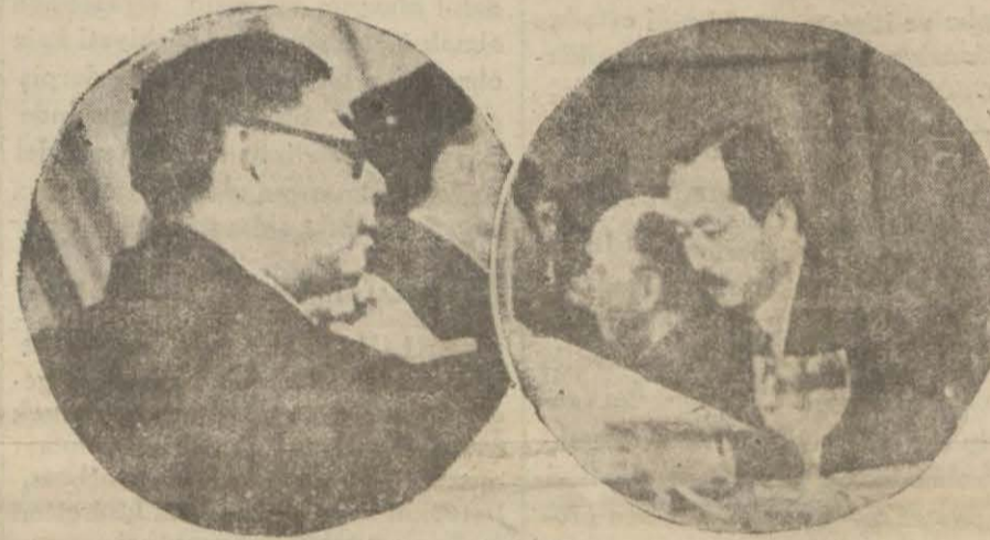
Cemiyeti akvamda Çin ve Japon murahhasları

Hadisatın bu günlük vaziyeti yeni ve daha mühim vak'alara yol açmağa müsait görünüyor.]