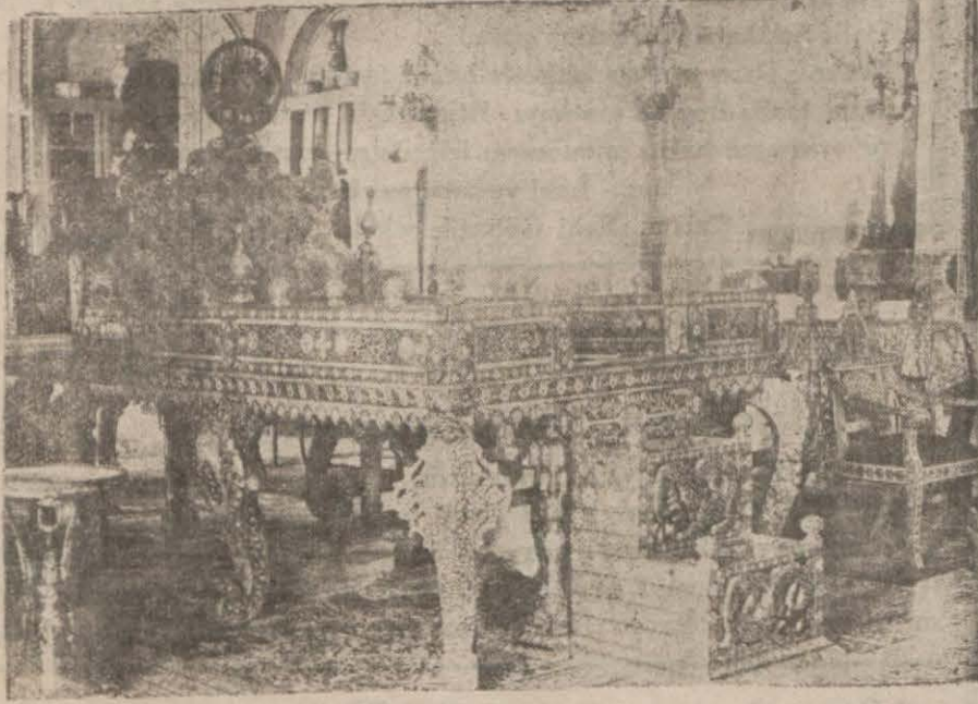
Nadir Şahin tarf.

İranda büyük küçük herkes şiir ve edebiyattan zevk alır, meşgul olur..