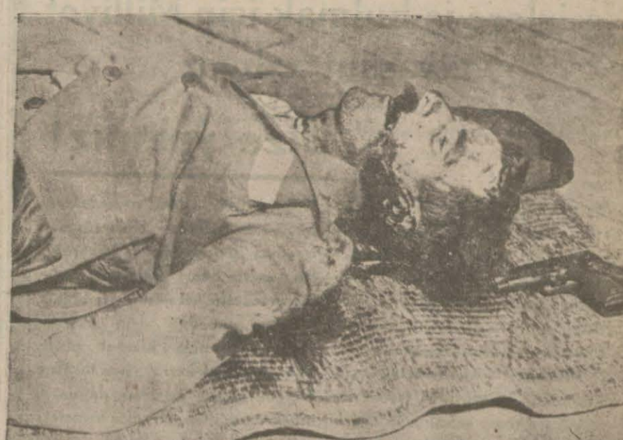
Bir komiserimizi şehit ettikten ve bir taharri memuru ile bir kıza da öldürmek kastile yaralandıktan sonra nihayet bütün sırları ile ölen ve öldürülebilen adam