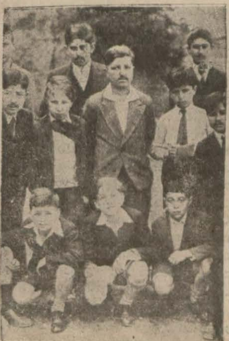
Halk evinde dün verilen çocuk müsamesesinde