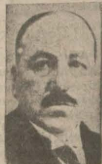
Encümen Reisi İSMET BEY

ANKARA, 28 (Telefon) — Maliye encümeni muvakkat müvazene vergisi kanun lâyihasını müzakere etmiştir. Encümen lâyihasında bazı tadilât yapılmıştır. Bu tadilâta göre asgari maaş tutarı 15 lira olarak tesbit edilmiştir. 15 liraya kadar aylık alanların bu vergiden istisna edilmele-