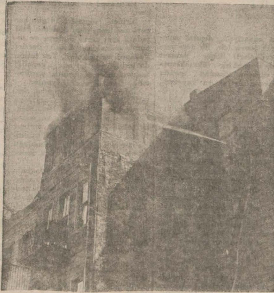
İtfaiye yangını söndürmeğe çalışıyor

İtalyan ressamlarından M. Rino Villa Venedikten şehrimize gelmiştir.