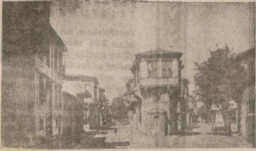
Mudanyada: Fevzipaşa ve İsmetpaşa caddeleri

Bursa-Yalova yolunu biran evvel yaptırmak lâzımdır..