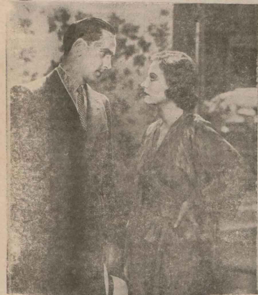
"Günahım" filminde Tallulah Bankhead

driüs bu ithama güler, fakat, Tap Consona karşı yapılan suikast üzerine Lulu'nun mücrim olduğuna kanaat getirir.