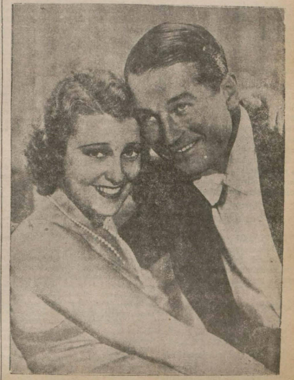
Yeni çevirdikleri "Bir saat seninle" filminde Jeanette Macdonald ve Maurice Chevalier