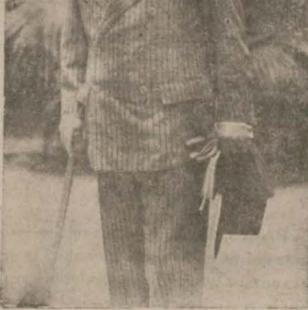
Kıbrıs valisi Sir Storrs

Ankaran avdet ettiğini yazdığımız Kıbrıs valisi Sir Ronald Storrs dün şehrin muhtelif yerlerini gezmiştir. Sir Storrs bir iki gün sonra Kıbrıs'a