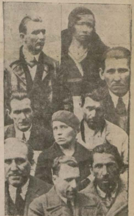
Mücevher ve kasa hırsızları bir arada

Zabıta, Beşiktaş malmüdürlüğü (Devamı 5 inci sahitede)