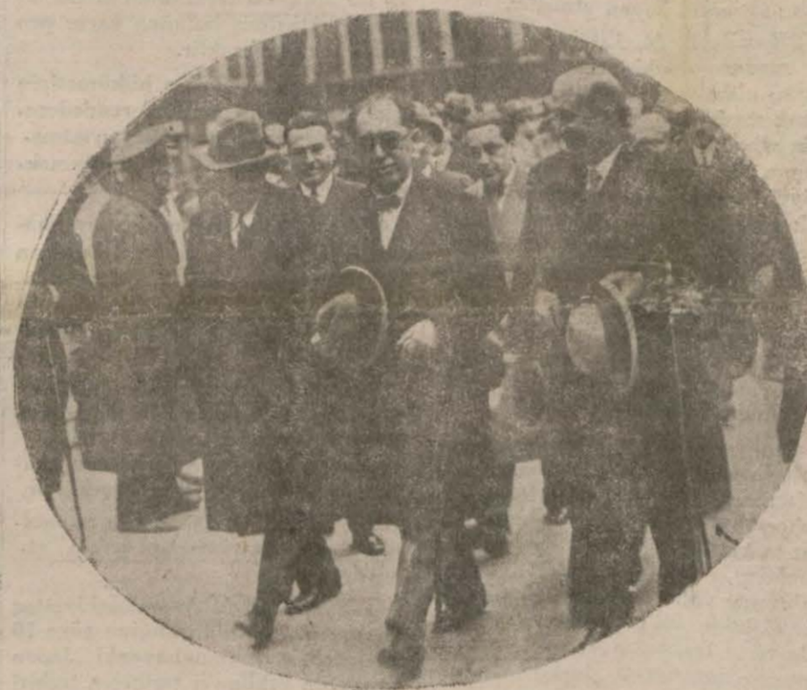
Hariciye Vekili Tefvik Rüştü Bey Sirkeci istasyonunda istikbal ediliyor

nin Cemiyeti Akvama girmesi esas itibarile tekrâr etmiştir. Tefvik Rüştü B. tahdidi teslihat konferansında irat ettiği nutukta bu noktaya temas etmiştir. Vekil B. in nutukunda bilhassa şu cümleler nazarı dikkati caliptir: "Bugün yüksek mihrabında sesimizi iğittirmek şerefine mübahi olduğumuz umum sulh ve anlaşma mefküresine en iyi bir makes olduğuna zannettiğim siyasetiminin hututu umumiyesini tarif eyle-dim. Eğer maksadımı iyi izah et-timse, eğer Türkiye'nin size izah ettiğim şekilde siyaseti Cemiyeti Akvamın ruhuna muvafık ise sizlere temin edebilirim ki Türkiye Cumhuriyeti bu asil davaya iltihakta hiç bir mâni görmeyecektir. Bu sözlerle pek muhterem İspanyol murahhası M. Salvador Madariga'nın bir ay evvel irat ettiği nutukta ki ve nutuktan bir