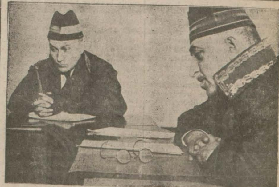
Sekizinci İhtisas heyeti hakimesi muhakeme esnasında