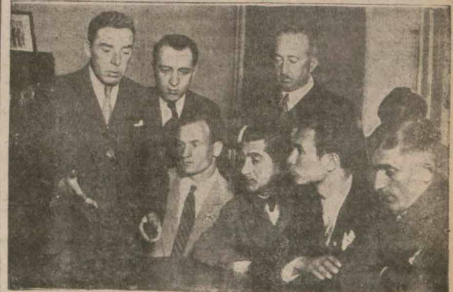
Federasyonda milli takım azası konferans dinlerken

Yapacağımız bu milli maçlar takımımızın 22 inci ve 23 üncü millî teması olacaktır..