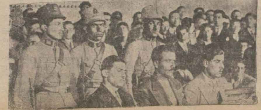
Bir hiç yüzünden bir cinayet oldu. Şimdi bu facia davasına başlandı.

Memurlar kooperatifte ihtiyaçlarını evrakı nakdiye ile değil, hükümet tarafından çıkarılacak satın alma bonolarile temin edeceklerdir. Aynı gazeteye göre memurlara maaşları- [Devamı ikinci sahifede]