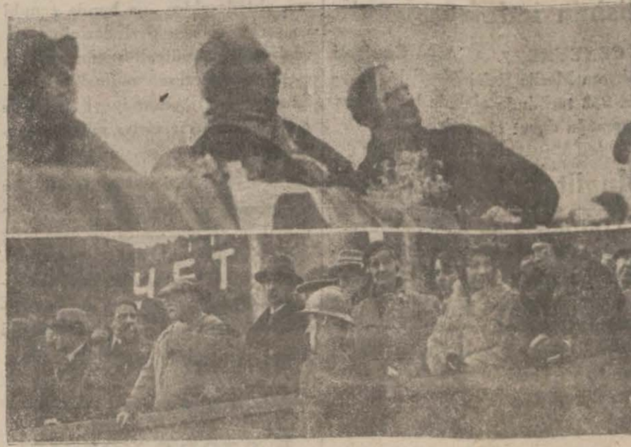
Başvekili İsmet Paşanın seyahatı devam ediyor. Resimlerimiz Başvekilin Moskova'da 1 Mayıs tezahüratını tetkik ederken göstermektedir. [Başvekilin seyahatına ait haberler son telgraflarımızdadır.]

— "Sizi burada kendi ara- mızda gördüğümüz için asil biz teşekkür etmeliyiz. Yakın- da sizi, sizin memlekette de görmeyi ümit ediyorum!..