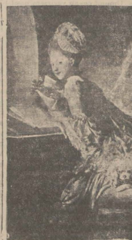
Aşk mektubu (Fragonard)

Fragonard evvelâ Chardin'in talebesi olarak resime başlamıştır. Bir noterin yanında kâtip bulunduğu sıralarda Boucher kendisini o tuzlu defterlerin arasından çıkararak Chardin'e teslim etmiştir. Uzun müddet Chardin ile beraber çalışan Fragonard bilâhara Boucher'in yanında da çalışmıştır. Fragonard iptida Boucher'iyi taklide başlamış, o kadar ki Boucher kendi resimlere onları terfih edemeyecek bir vaziyete gelmiştir. Bu sebepten saray için yapılacak halı örneklerini kartonlara yaptırmak için Boucher'in siparişlerini ekseriya Fragonard yaparmış.