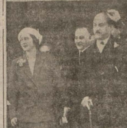
Yukarıda: Romanya Kraliçesi Hazretleri, aşağıda Yugoslavya Kraliçesi Hazretleri istasyonda karşılanırlarken...