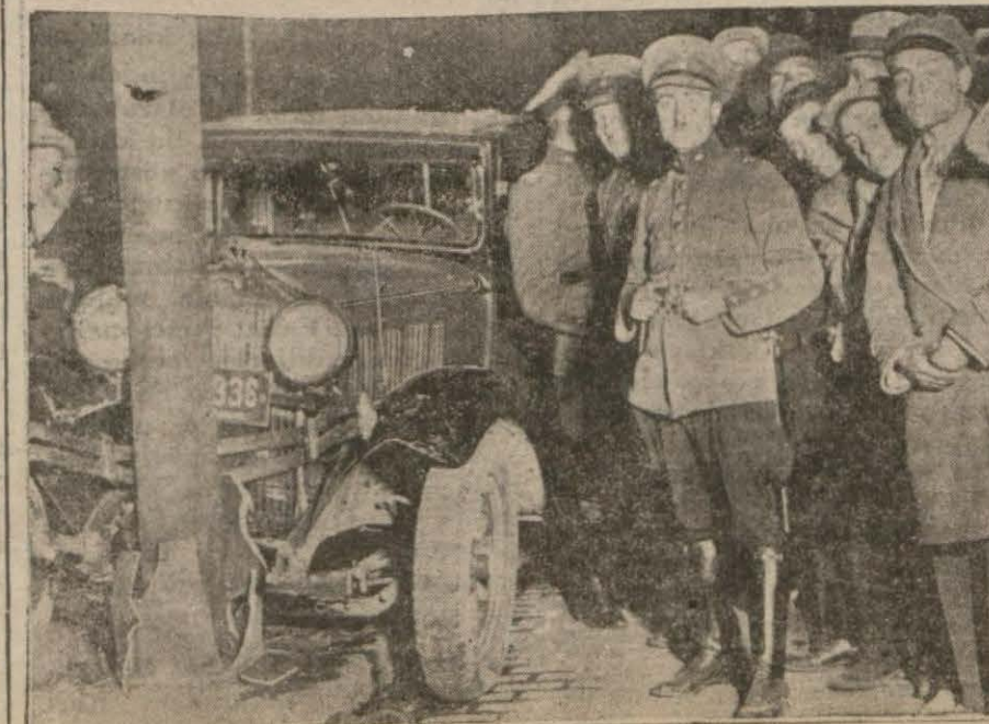
Dün akşam köprü üstünde gene bir otomobil parçalandı, üç yaralı var. — Yazısı üçüncü sahifede —

kâletlerle emniyet umum müdür lüğü, gümrükler, posta ve telgraf tapu ve kadastru umum müdürlük leri (Devamı 6 ncı sahifede)