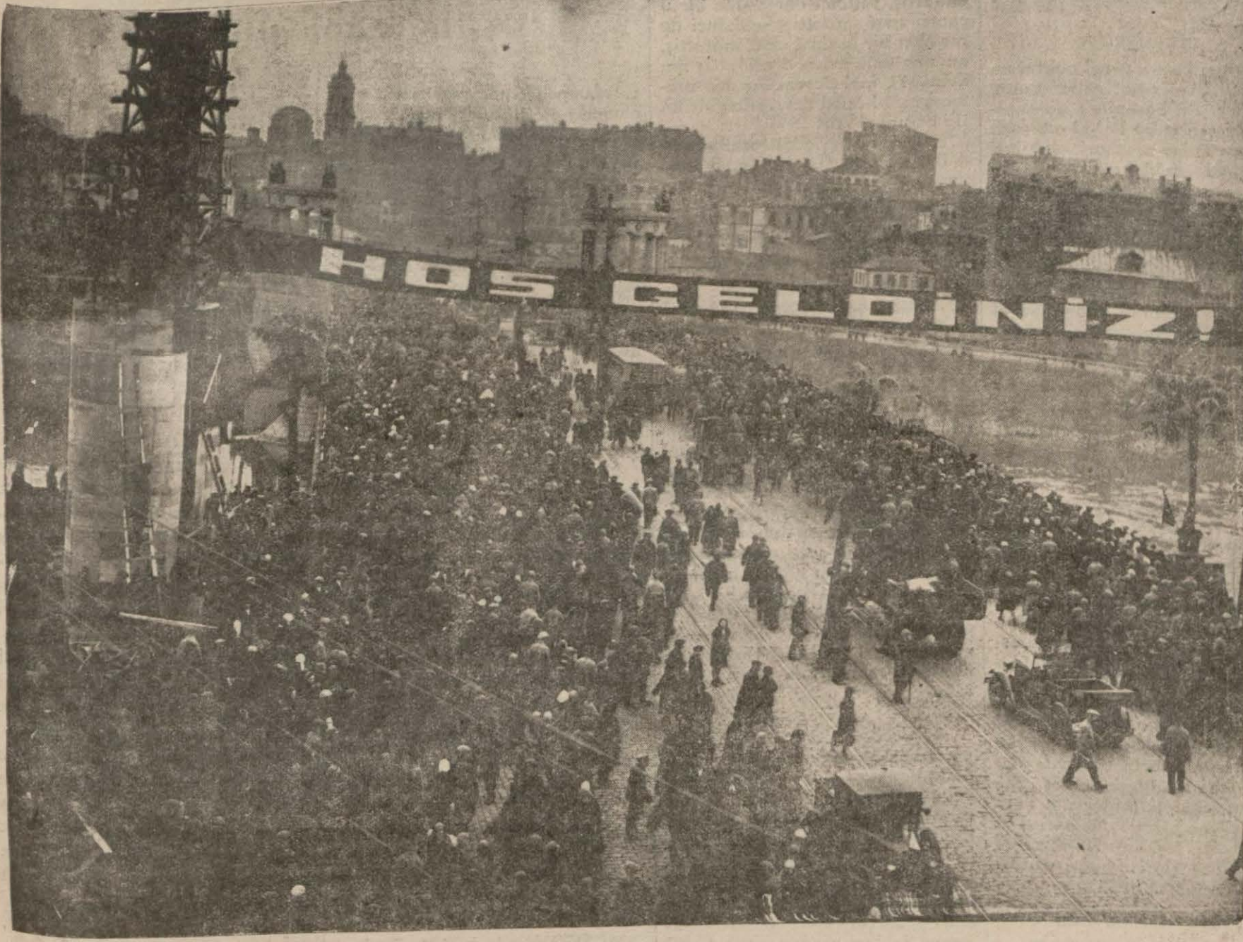
Moskova sokaklarında halk Türk heyetinin geçmesini bekliyor..