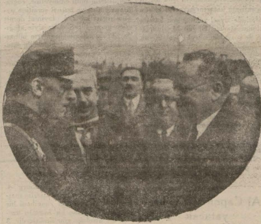
İsmet Paşa ve hariciye komiseri Litvinof