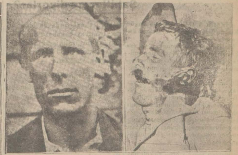
Cam gözli canavarın ölüm halindeki fotoğrafı ile ikamet vesikasındaki resmi birbirine benziyor mu?

Eve düşen yıldırım! romanını lezzetle okuyacaklarından eminiz.