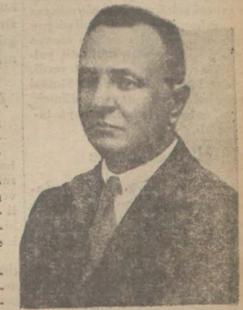
Üstadıazam Mustafa Hakkı B. gibi, biz böyle bir mason teşekkülü bilmiyoruz." Diğer taraftan öğrendiğimiz göre, nizamnameye ve masonluk [Devamı 5 inci sahifede]

"Yeni bir mahfel tesisine teşebbüs edildiğini gazeteslerde okuyoruz. Bizim bundan malûmatımız yoktur ve böyle bir mason teşekkülü de bilemiyoruz. Bütün mesele şudur: Teşkilatımıza evvelce mensup olan 5 kişi, masonluk kavaidile kabili telif olmanın ve hükümetçe musaddak bulunan nizamnamemiz ahkâmına uymanın bazı hareketatı bulunmuş olduklarından ihraç edilmişlerdir. Yeni teşekkül için de kanunen asgari 5 kişi lâzım imiş. İşte bu 5 zat tarafından yapılmakta olduğu anlaşıyor. Biraz evvel de söyledim.."