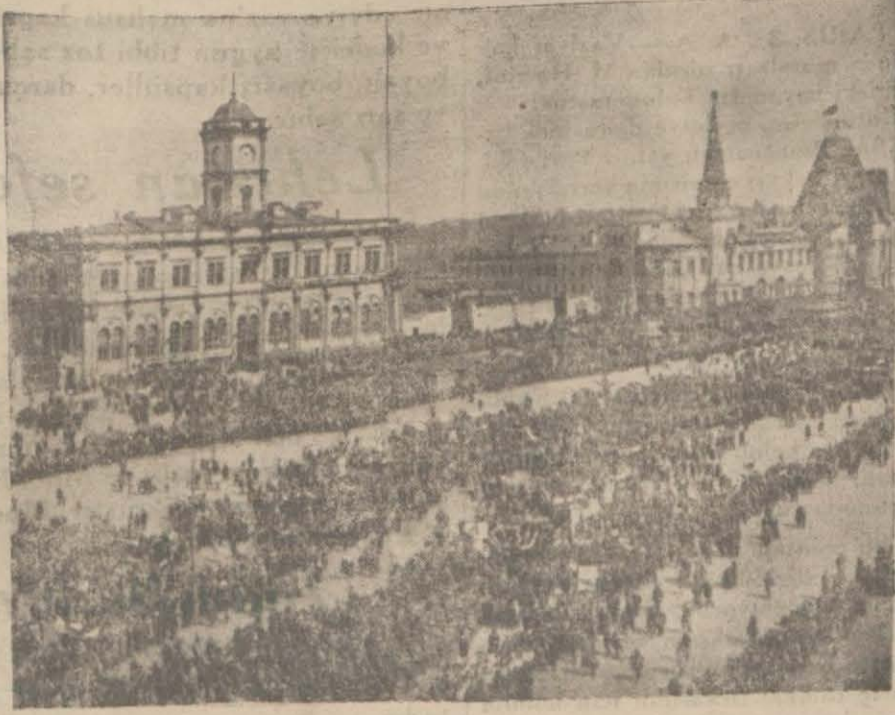
Moskovada 1 Mayıs resmi geçidi ve tezahürat