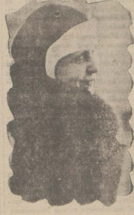
Kraliçe Mari Hz.

ANKARA, 3 A. A. — Romanya ve Yugoslavya kraliçeleri Hazretatı Çarşamba günü saat 12 de ekspresle İstanbul'a muvazalet edeceklerdir. Gerek istikballeri ve gerek İstanbul'da bir hafta sürecek olan ikametleri için hükümetçe lüzım gelen tedbir itihaz olunmuştur. Edirne valisi kendilerini Bulgar hududunda selâmlıyacak ve İstanbul hududuna kadar refakatlerinde bulunacaktır. Hariciye vekâleti tarafından