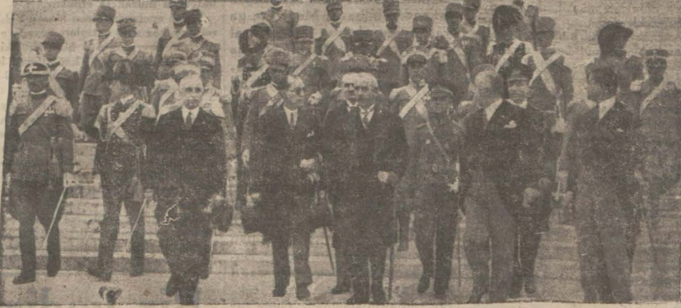
İsmet Paşa ve Tevfik Rüşti Beyin Roma seyahatinden bir intiba.