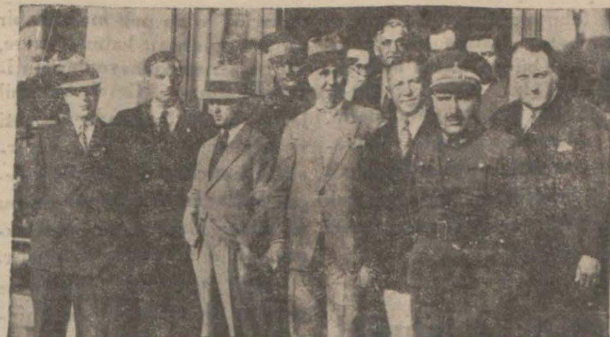
Teknik heyet dün yarış sahasını tetkik etti. Resmimiz bu heyeti toplu bir halde gösteriyor. Yarış talimatnamesi ve yazısı iç sahifemizedir.

çağırıldı. Herriot 1924 intihabatından sonraki tecrübeyi tekrar etmek istemiyor. Ve bunu tecrübe etmek istemeyip te sol yerine sağ ile teşriki mesai ede-