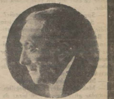
Hüseyin Rahmi Bey