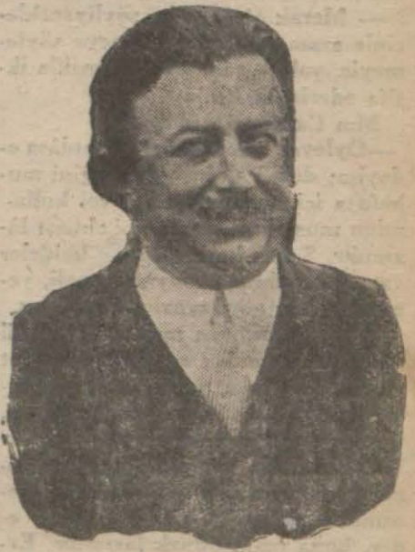
Dahiliye vekili Ş. Kaya B.

«Memleketimizin hususî ve iktisadî bünyesi ve şartları ve milletimizin kuvvet ve mukavemetine inzımam eden ve vaktinde alınmış olan devlet tedbirleri sayesinde umumî buhranın tesirleri her memlekettenden daha az olmuştur. Ziraat ve san'at sahasındaki istihsalin mütemadiyen artan tekküsürüne ve ucuzluğuna rağmen küçük şehir ve kasabalarımızda yaşama ve geçim icap ettiği kadar ucuzlanmamıştır. Ve Türkiye-mizde memleketimizin ve mil-