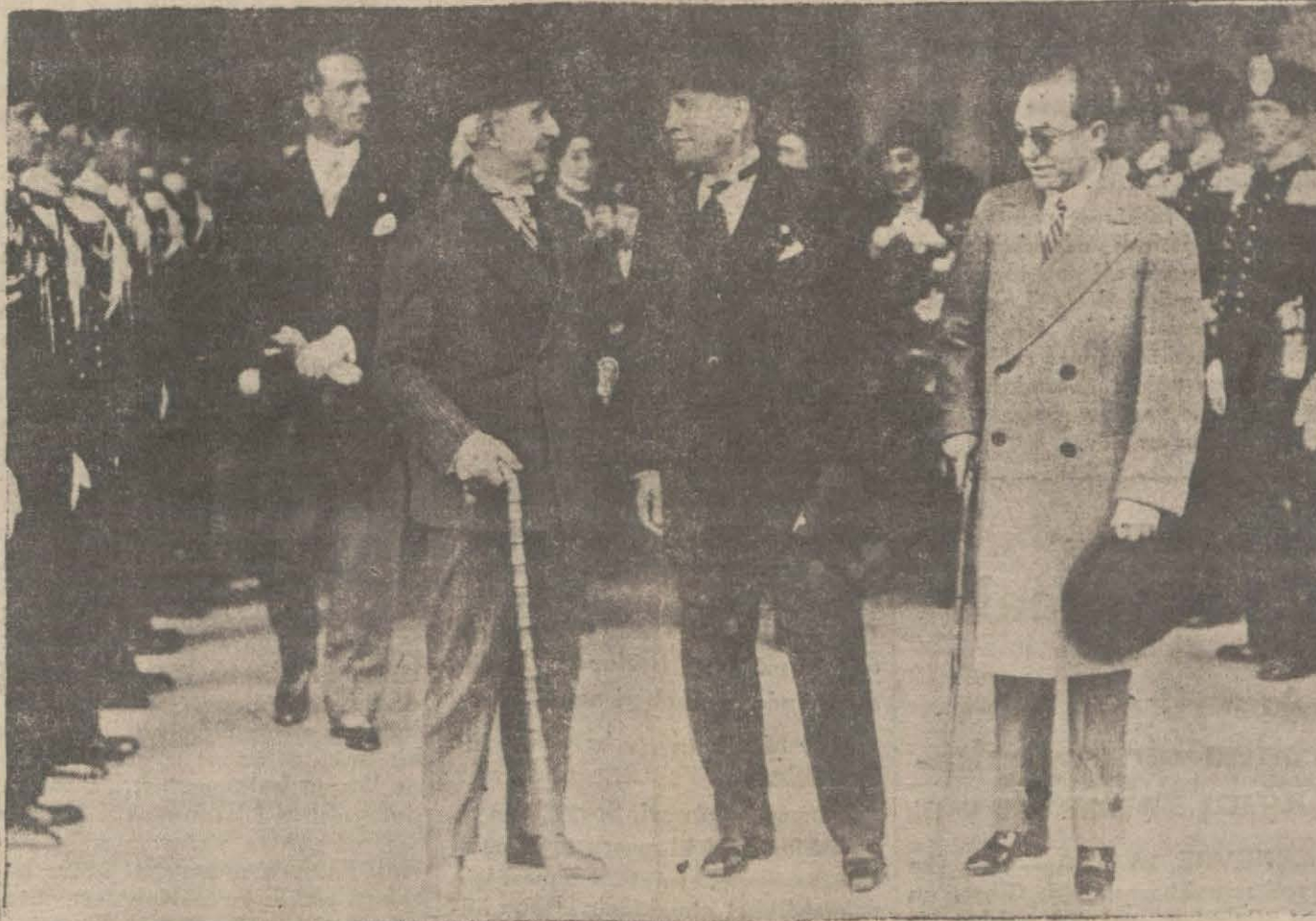
Kemalist ve Faşist iki milletin başvekilleri Roma istasyonunda..