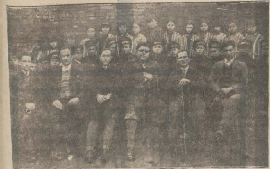
Malkara'da erkânı hükümet ve himaye edilen çocuklardan bir kısım

MALKARA: Mürettefe bir iki saat meşgul olduktan sonra (Marmara) geldi. Rüzgâr çok sert, vapur uzakta, korku ve helecane içinde büyük bir müskülâtla kendimizi güğürtmeye attık ve 3 saatte Tekirdağna geldik. Vapur iskeleye öyle bir bindirdi ki koca iskele baştan başa yerinden oynadı ve öyle zannediyordum ki artık o iskeleye de hayır kalmadı! Eğer bir iki defa daha bu hal tekrar ederse o iskenin hayrini görmelidir!