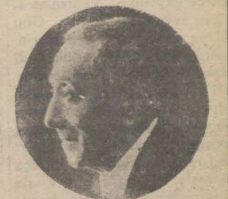
Hüseyin Rahmi Bey