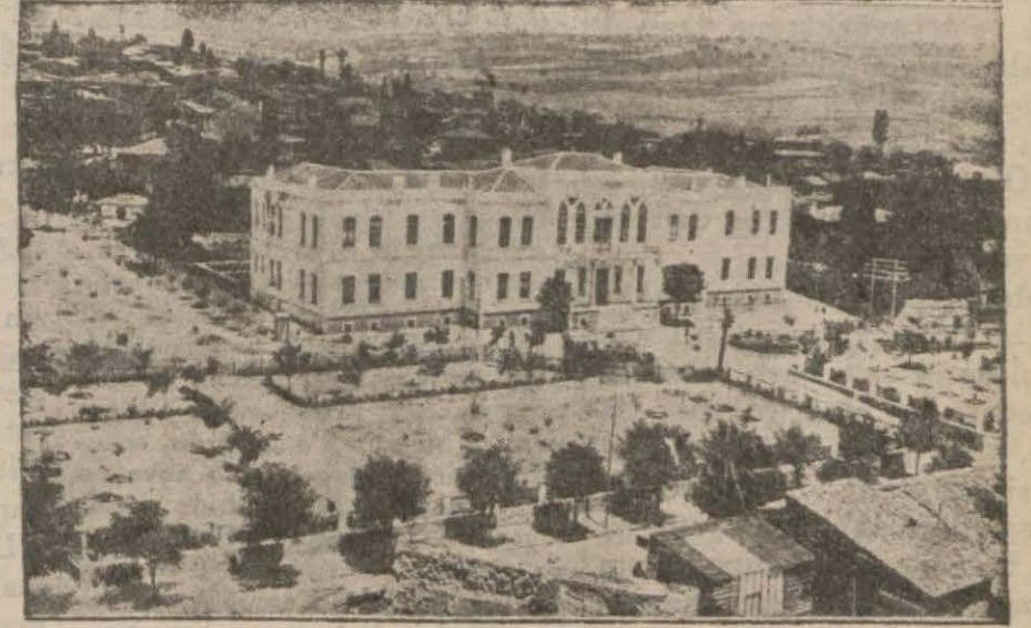
Tekirdağ hükümet konağı

TEKİRDAĞI: İstanbuldan sonra Marmarannın Rumeli sahilinde en büyük ve en meşhur bir vilâyet merkezi olan Tekirdağ'ı niki sene evvel bir daha ziyaret etmişim. Bu müddet zarfında burada göze çarpmak bazı değişiklikler olmuş ve asri terakki hesabına kaydedilecek tesiat vücut getirilmiştir. Şehir elektrik ile tenvir olunmuş birçok yeni mağazalar ve bunlardan daha çok mühim olarak bir şarap fabrikası yapılmıştır.