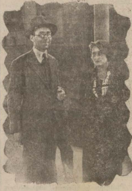
Dün gelen Yugoslavya murahhasları

Dün başlaması muhterem olan Balkan Tezahürat Haftası, Yugoslav murahhaslarının bugün şehrimize vasıl olmaları anlaşılması üzerine bir gün tehir edilmiştir. Bu suretle bugün başlayacak olan hafta, 26 mayıs perşembe gününe kadar devam edecektir. Bu hafta zarfında Türk Balkan Birliği Gurupu, şehrimizde Balkan memleketlerini alâkadar eden ticari, sinai ve iktisadi meseleler etrafında tezahürat yapılacak, konferanslar verilecektir. Tezahüratı