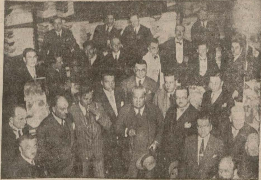
Resmi kışatta hazır bulunan zevattan bir grup..