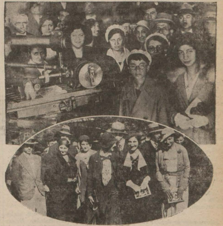
Sergide teşhir edilen bir makina, talebe ve ziyaretçiler

Dün Robert College'de talebenin bir sene zarfındaki müktesebatını gösteren bir sergi açılmıştır. Sergide talebe tarafından vücutta getirilen muhtelif cins makineler, tornacılarla ait alâet ve edevat, kimya laboratuvarında hazırlanan kimyevi maddeler, mimari kısmında hazırlanan planlar, demirciliğe ait alâet ve edevat, dökümhanede ve elektrik laboratuvarında vücutta getirilen eşya ve makineler teşhir edilmiştir. Robert College'in mühendis kısmı talebesi aynı zamanda laboratuvar ve imalâthanelerde, bazı tecrübelerine pparak ne gibi atletlere çalıştıklarını davetlilere göstermişlerdir. Davetliler arasında Mühendis mektebi müderrisleri, son sınıf talebesi ve bazı mektep müdür ve muallimleri ve talebe velileri bulunmaktadı. Sergi gezildikten sonra davetlilere mektebin bahçesinde dondurmalar ikram edilmiştir.