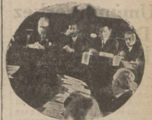
İçtimadan bir köşe..

karar itihaz olunmasına dair daimî encümenin ve Belediye hizmet ve müessesatında müstahdem olanlardan kimlere elbise bedeli verilmesi hakkındaki teklife dair