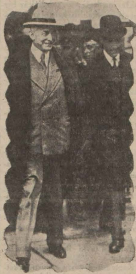
Yeni sefir istasyonda

Sefir itimatnamesini vermek üzere bugün Ankaraya gidiyor