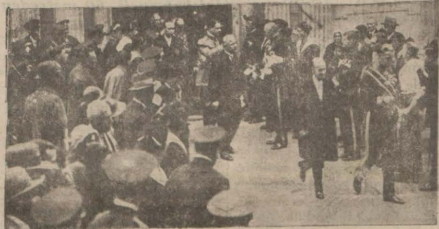
Şehrimizde yapılan ayın esnasında