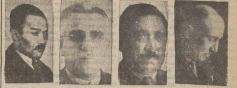
Avni I. Şevket G. Bahtiyar Nazmi Nuri B.let

İtimatnamemi Reisi cumhuriyet Hz. ne taksim için yarın Ankara'ya gideceğim.