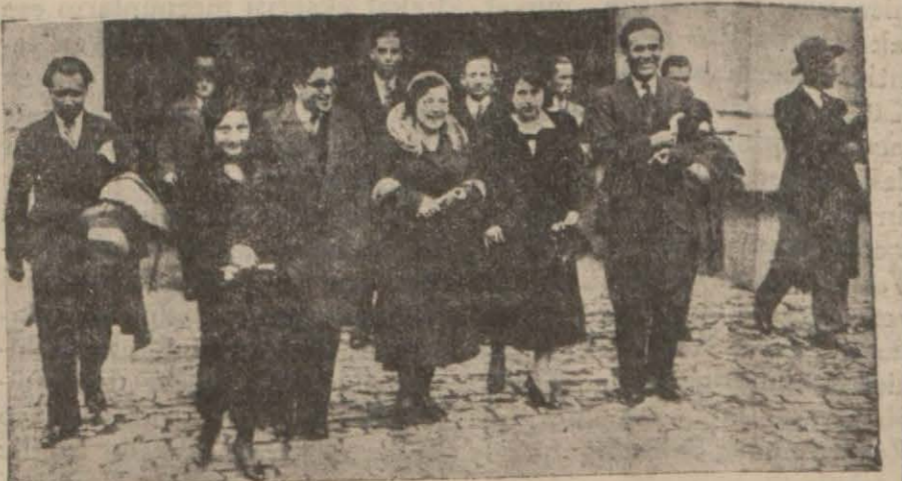
Tıbbiyeliler Bayramı münasebetiyle, dün saat 14 te Tip Fakültesinde pek canlı ve samimî merasim yapılmıştır. Bu merasimde bütün Tip Fa-

Türk doktorluğunun asırlarca uzanan çok derin kökleri vardır