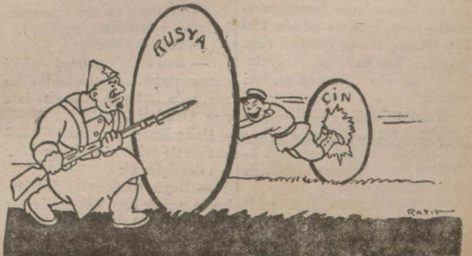
Japon — Bir de bu çemberi atlayabilsem!..