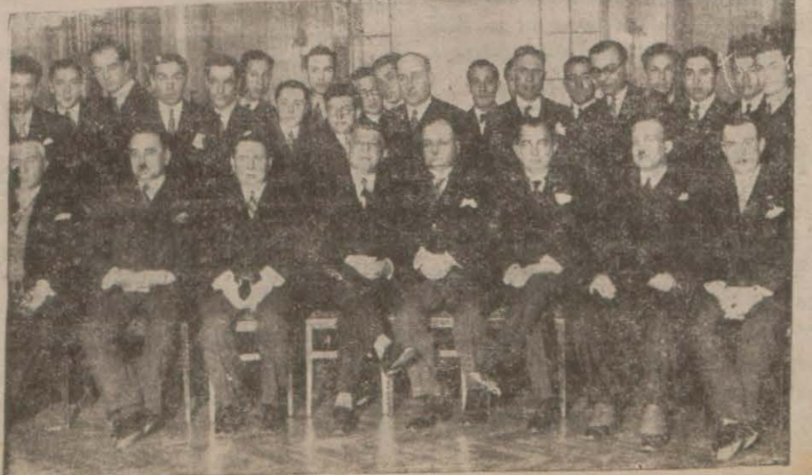
Mehteri Mülkiye talebesinin dün Tokatlyanda verdiği çay ziyafetinde.

VARŞOVA, 8 (A.A.) — Diyet meclisi ikinci ve üçüncü kuraatlerinin de Türki - Leh ikamet müahedenamesini tasdik etmiştir.