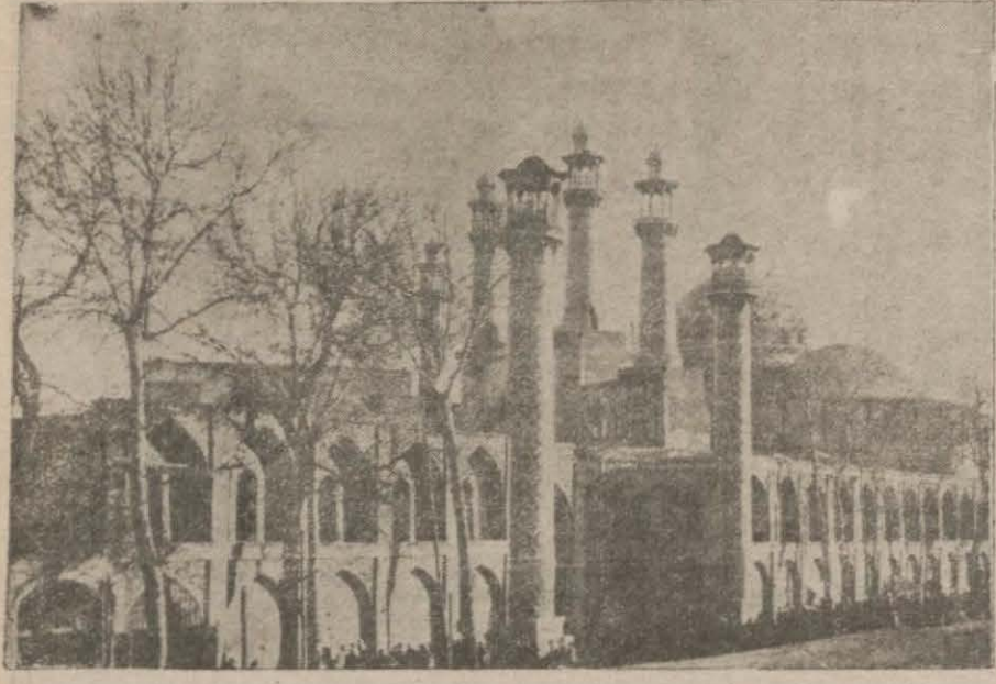
Tahranda tarihi bir medrese