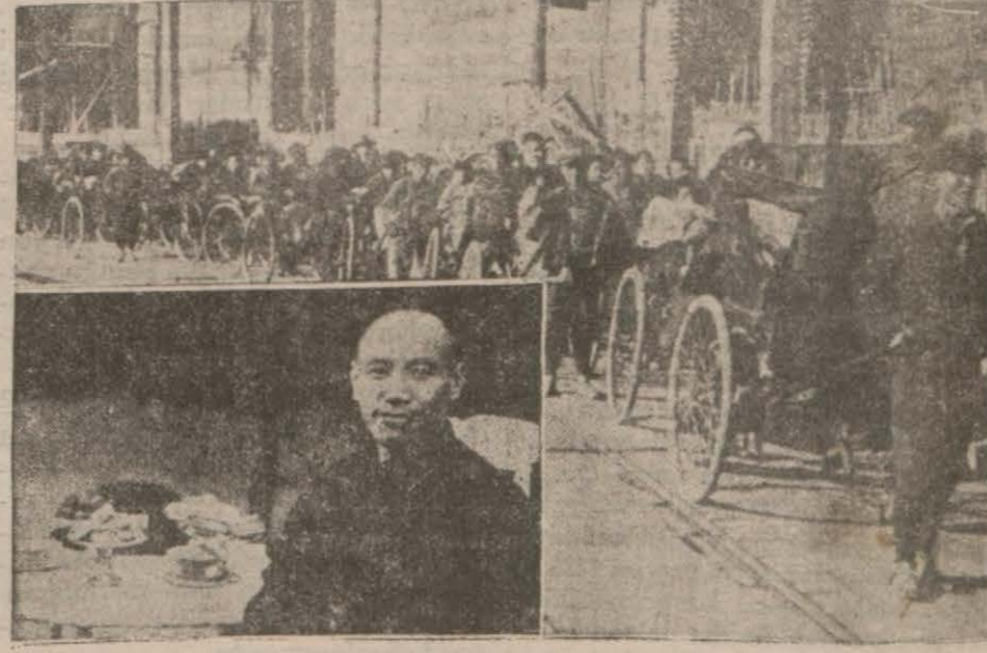
Mütemadiyen beynelmil mintakaya taşınan sivil ahalî ile cepheye gideceği haber verilen Chan Kai Chek

imperatoru Puyi dün öğleden sonra yeni Mançuri devletinin merkezi olan Chang Chun'a gelmiştir.