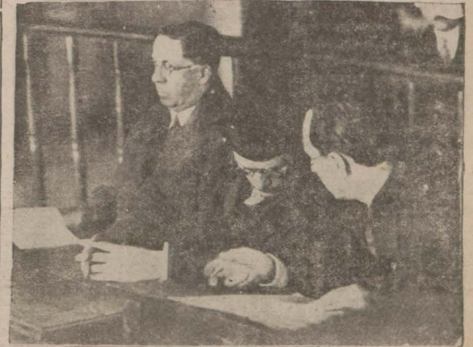
Avukatlar mahkemede görüşüyorlar.

Bir muallim ve üç sınıf köy mekteplerinin, bir muallim ve beş sınıf bir hale ifrağı hakkındaki Celbelibereket meb'usu Hasan Basri Beyin takrirî üzerine müzakere cereyan etmiş ve Maarif Vekili Esat Beyin verdiği izahat kâfi görülmüş tür.