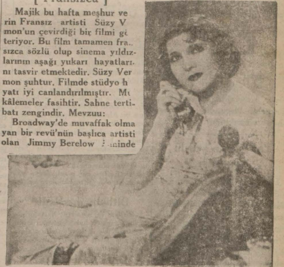
'Kadınlar Avukatı,, filminden