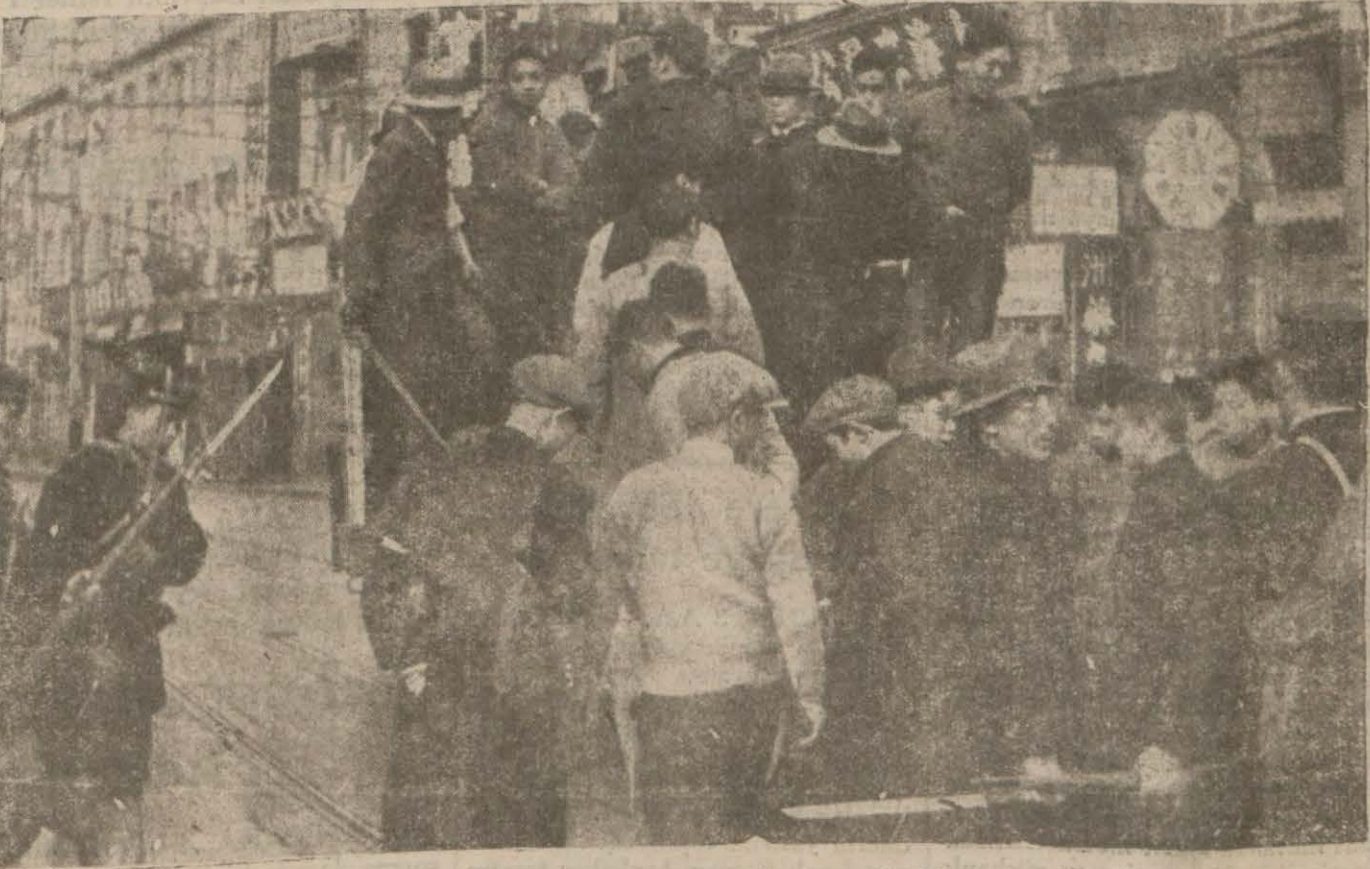
Japon süngüleri arasında Çinli mevkuflar