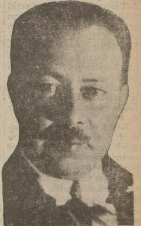
Yakında yeni bir eserle Milli kütüphanemizi tezvin edecek olan güzide edip Falih Rifki Bey