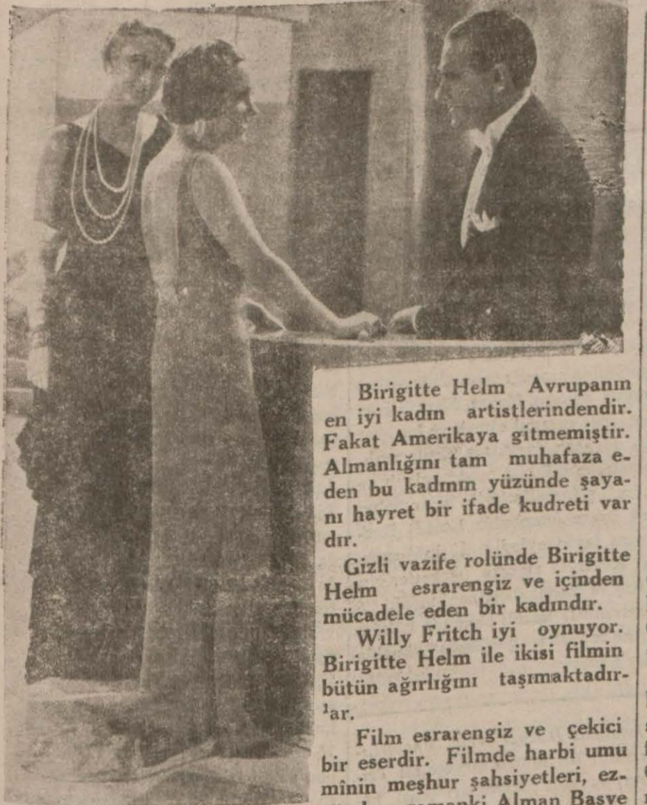
'Çılgın Dul,, filminden

Aldığımız mevsuk bir habere göre "İpekçi Kardeşler" firması İstanbulda bir sesli film stüdyosu tesisine karar vermiştir. İpekçi Fahir Bey bu maksatla bir iki gün evvel Avrupa'ya gitmiştir. Stüdyonun Mecidiyeköyü civarında olacağı söyleniyor. Bu stüdyonun tesisinde de Darülbeyazı rejisörü Ertuğrul Muhsin Beyin çalışacağı rivayet ediliyor.