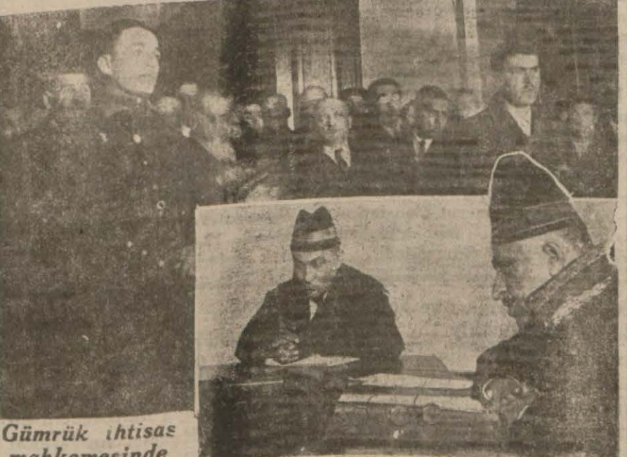
Gümrük ihtisas mahkemesinde ilk dava

Sekinci ihtisas mahkemesi dün faaliyete başlamış ve Gümrük binası dahilindeki mahkeme salonunda iki dava rüyet etmiştir. Bu davalardan birincisinin maznun sıfatile Loyd Tir-