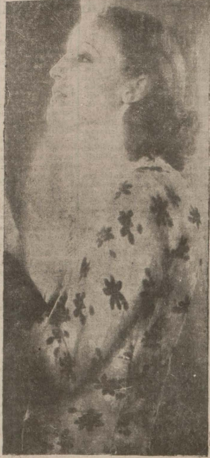
Birigitte Helm Elhamra'da