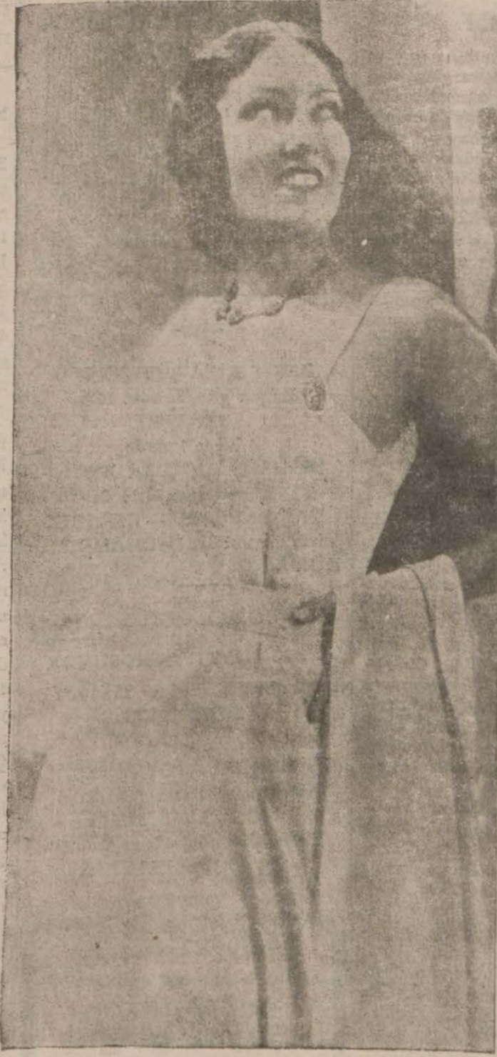
Gloria Swanson Artistik'te