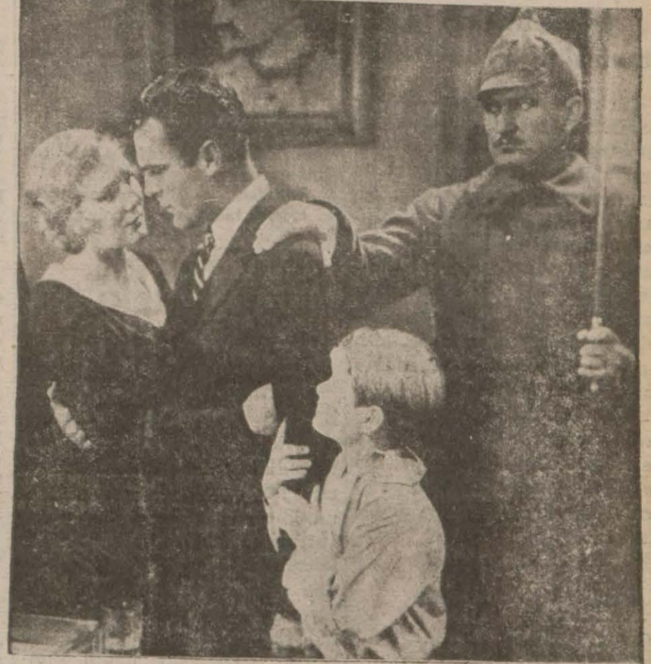
'Moskova Çocukları,, filminden bir sahne