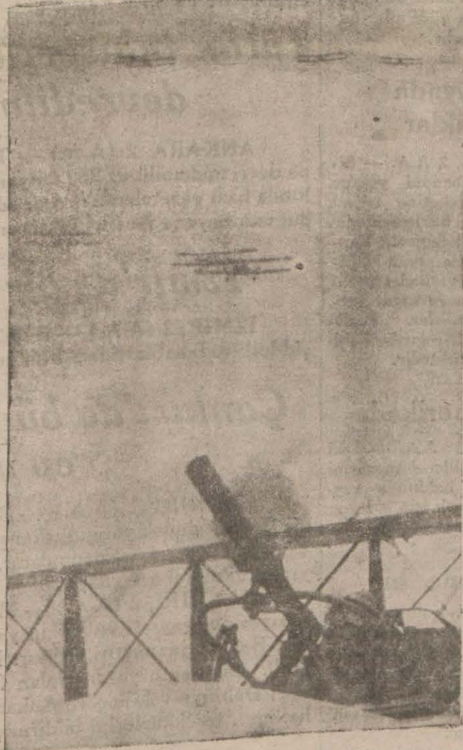
Chapei'i bombardıman eden Japon tayyarelerine havada bir nazar...