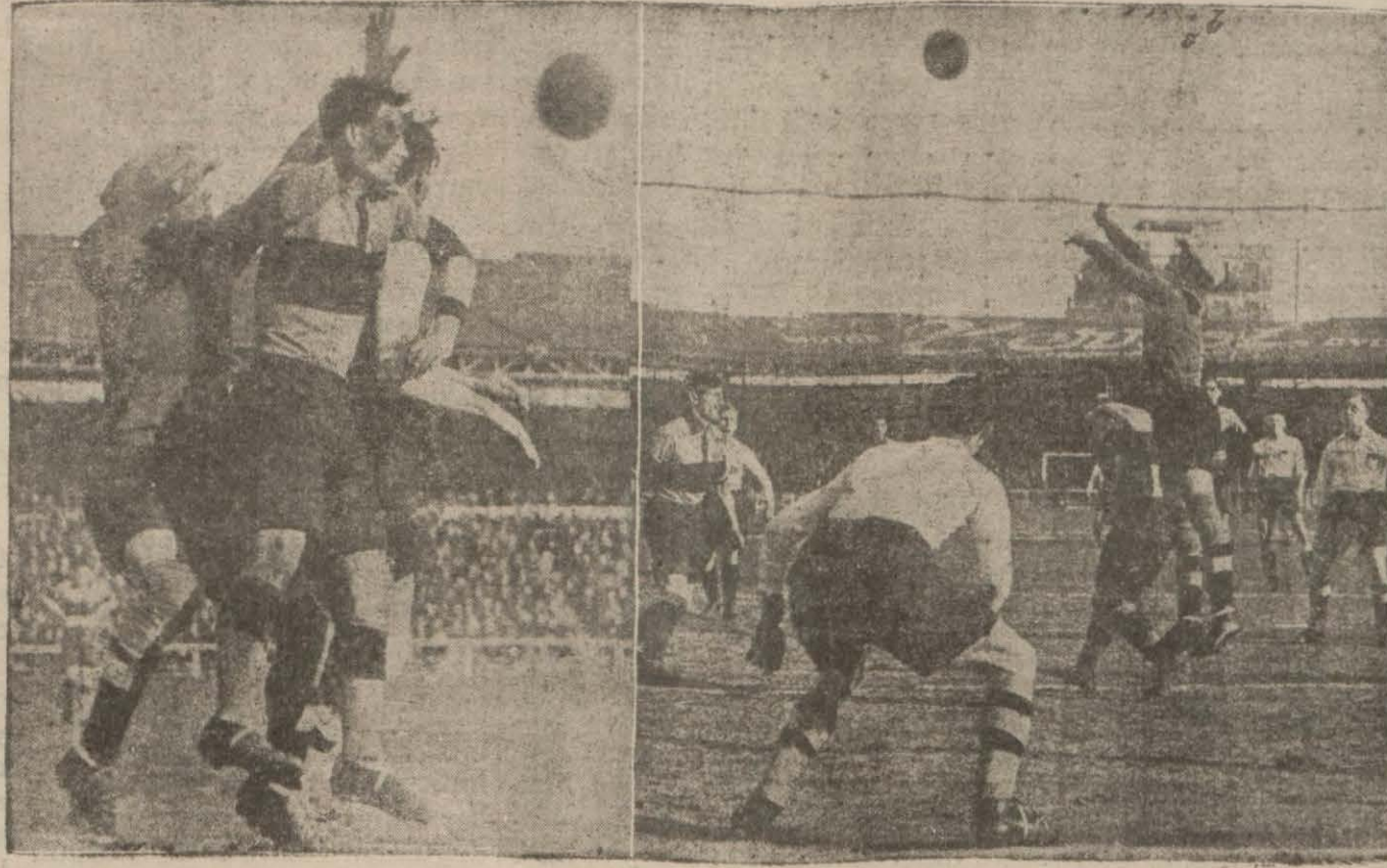
Paris — Cologne maçından iki enstantane...

Üç gole karşı Paris takımı, Cologne takımından hiç gol yemedi ve galip geldi