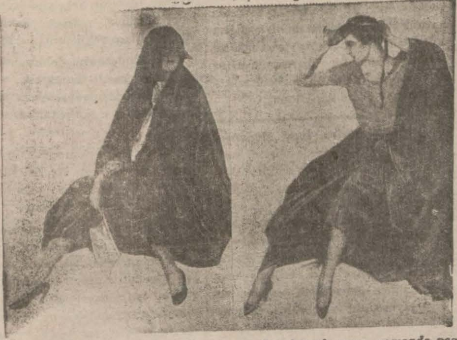
İranda kadınların çoğu çarşaf giyiyor. Bazılarında aynı zamanda peçe yerini tutan birer güneşlik vardır. Kadın resiminde görüldüğü gibi ilk önce onu başına koyar, ondan sonra çarşafını örtülür.

İranda saatlik, haftalık, aylık nikâh lar yapılıyor; gizli fuş yok gibidir