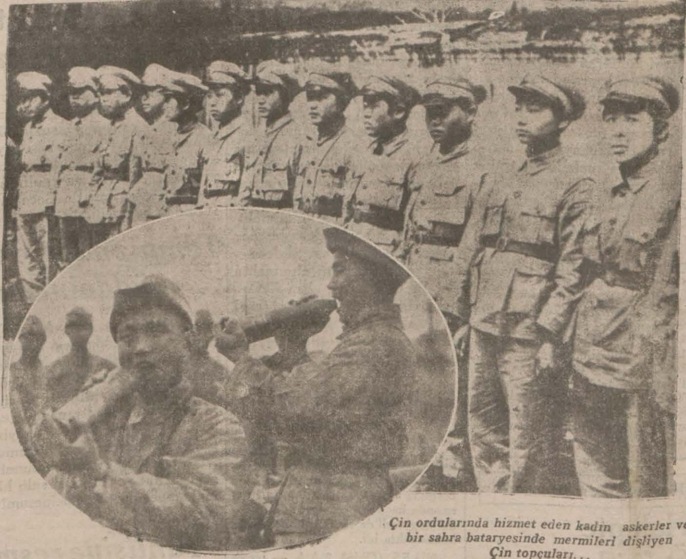
Çin ordularında hizmet eden kadın askerler ve bir sahra bataryesinde mermileri dişliyen Çin topçuları...