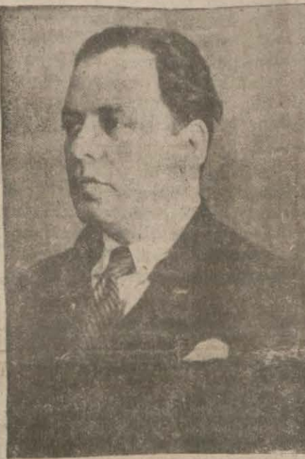
Hakkı Nezihî Bey

— Bu haber doğru değildir. Bu hususta hükümete hiç bir teklifte bulunmuş değiliz. Esasen böyle bir teklif için lüzumlu olan paraya da malik değiliz.