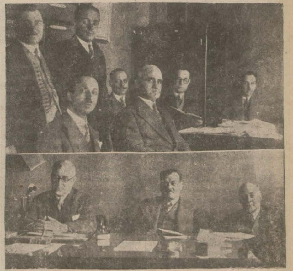
Haliç şirketinin heyeti umumiyesi içtima halinde

ANKARA, 28 — Inhisarlar da tasfiyeye tabi tutulacak memurların sicilleri her inhisar idaresinin memurin ve sicil müdiriyetlerince tetkik edilmiştir. Bundan başka inhisarların umumi masraf bütçesinde yapılacak tasarruf esasları da tesbit olunmuştur. Gümrük ve inhisarlar vekâleti meclise verilerek üzere dört muhtelif bütçe projesi hazırlanmaktadır. Bu projelerin mühim bir kısmı ikmal edilmiştir. Inhisarlar muhafaza umum müdürlüğü ve vekâletin merkez teşkilâtına ait bütçeler ayrı ayrı olarak tanzim edilmektedir. Inhisarların bu umumî müdürlük idaresinde tevhibi takarrür etmiştir. Fakat bu umumî müdürlüğün kaç şubelik bir teşekkül olacağı henüz tetkik edilmemektedir. Inhisar idarelerinin devlet baremi tatbik edilmeyecek, memurlar hususî bir barmen üzerinden maaş alacaklar.