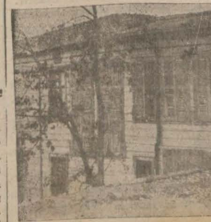
Dün meydana çıkarılan heroin ve kokain evkerinden.