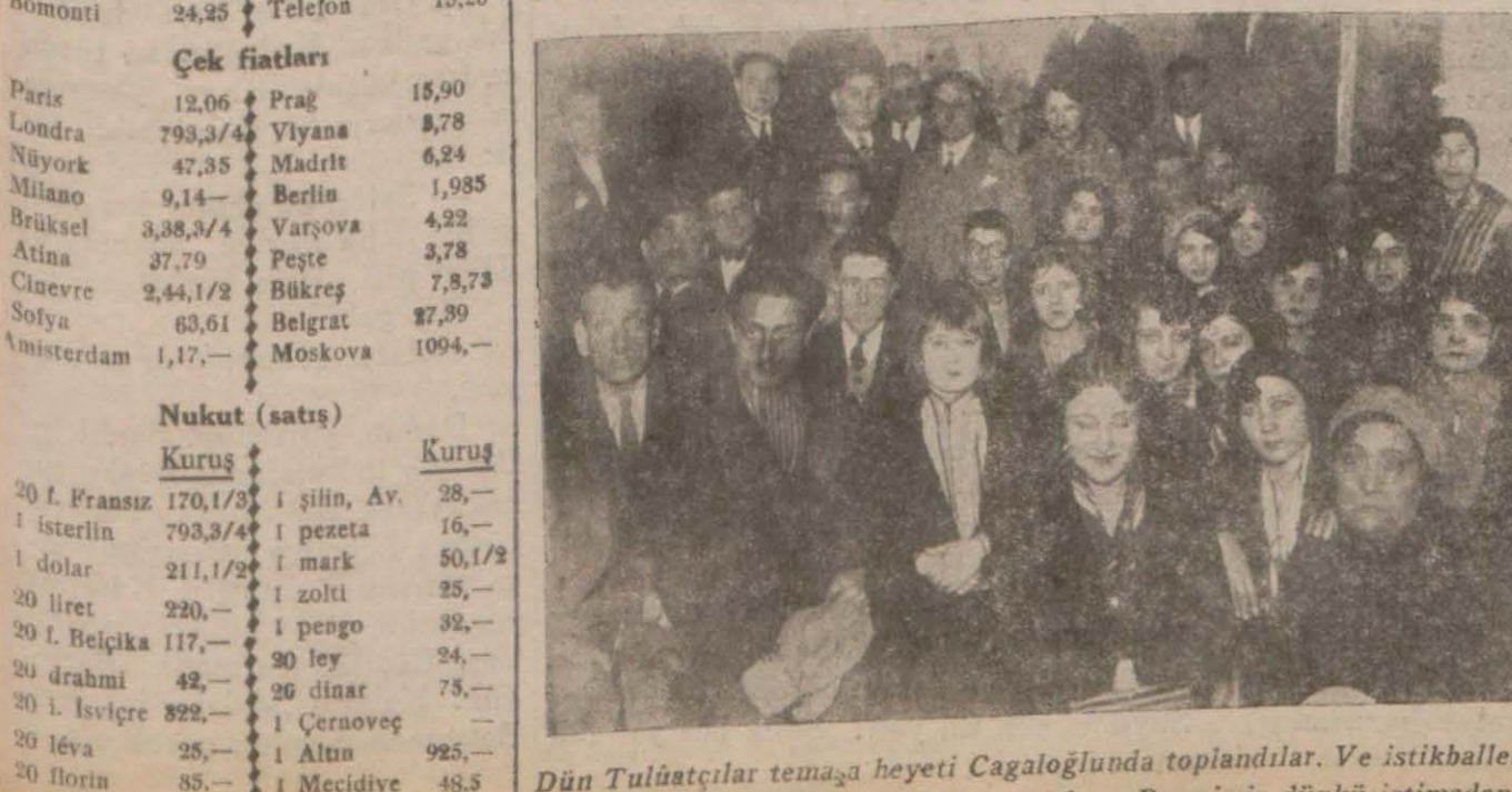
Dün Tulûatçıların temâşa heyeti Çagalöğlunda toplandı. Ve istikballeli-...

Buna nazaran, evrak Müzeler müdiriyeti tarafından tesellüm edilecektir.