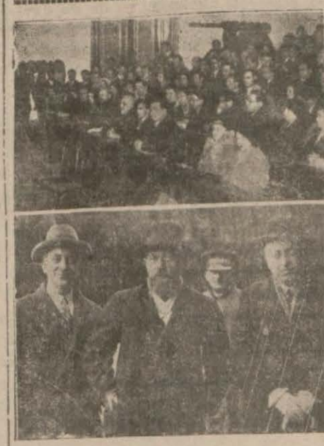
Dün Darülfünunda konferans veren Profesörlere gene dün gelen Fransız Profesörlüğü.

Bu kanunun hükümlerinden istifade için berat müddetinin bitmemiş olması ve kanunun neşri tarihinden itibaren bir sene zarfında müracaat edilmiş bulunulması lazımgelir.