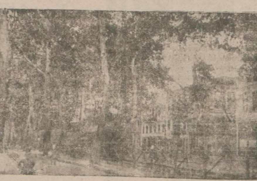
(İzmit) in şatane ..anzatlarından tiren yo..

Çene suyu şehre indirilecektir. Bu su en iyi sularımızdan biridir