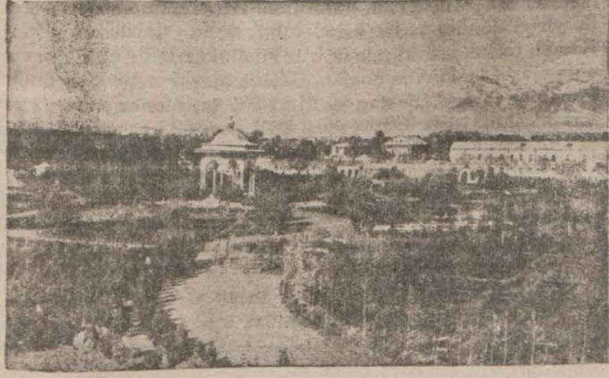
İranda Halk parkı

İranlılar ahyon yutmak gibi maziden kalma bir çok iptilâları terketmektedirler