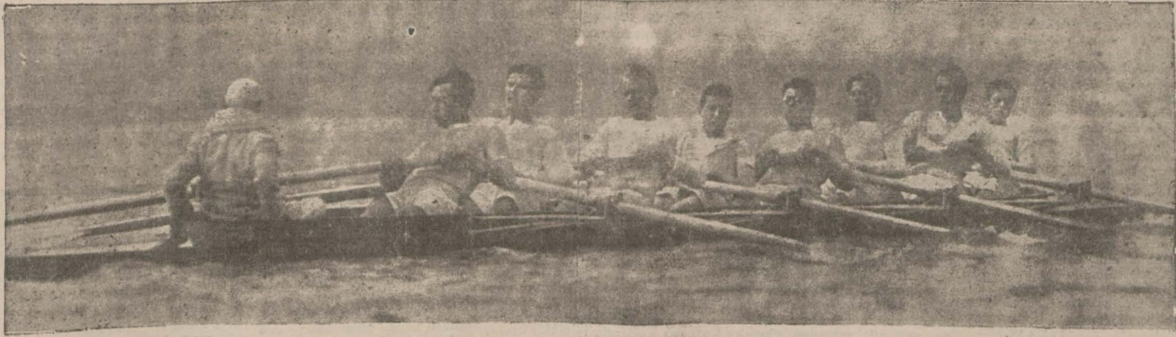
84 üncü Oxford - Cambridge maçını gene Cambridge kazandı. Resim, bunların sekizini faaliyet halinde gösteriyor...