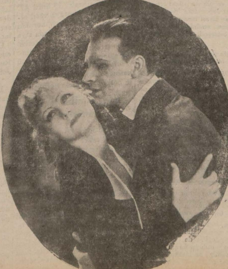
Greta Garbo Romance filminin başka bir sahnesinde

Halbuki (Gabi) yeni kocasını seviyor o da intihar etmiyor. Amma fakir delikanlı başka bir dul bulup milyonlara kavuşuyor..