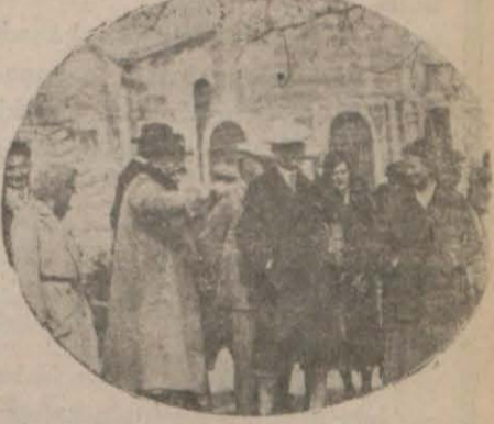
Seyyahlar Ayasofyada tercümanın izahatını dinliyorlar.

Cenevre ve Çin - Japon ihtilâfı CENEVRE, 17. A. A. — Uzak