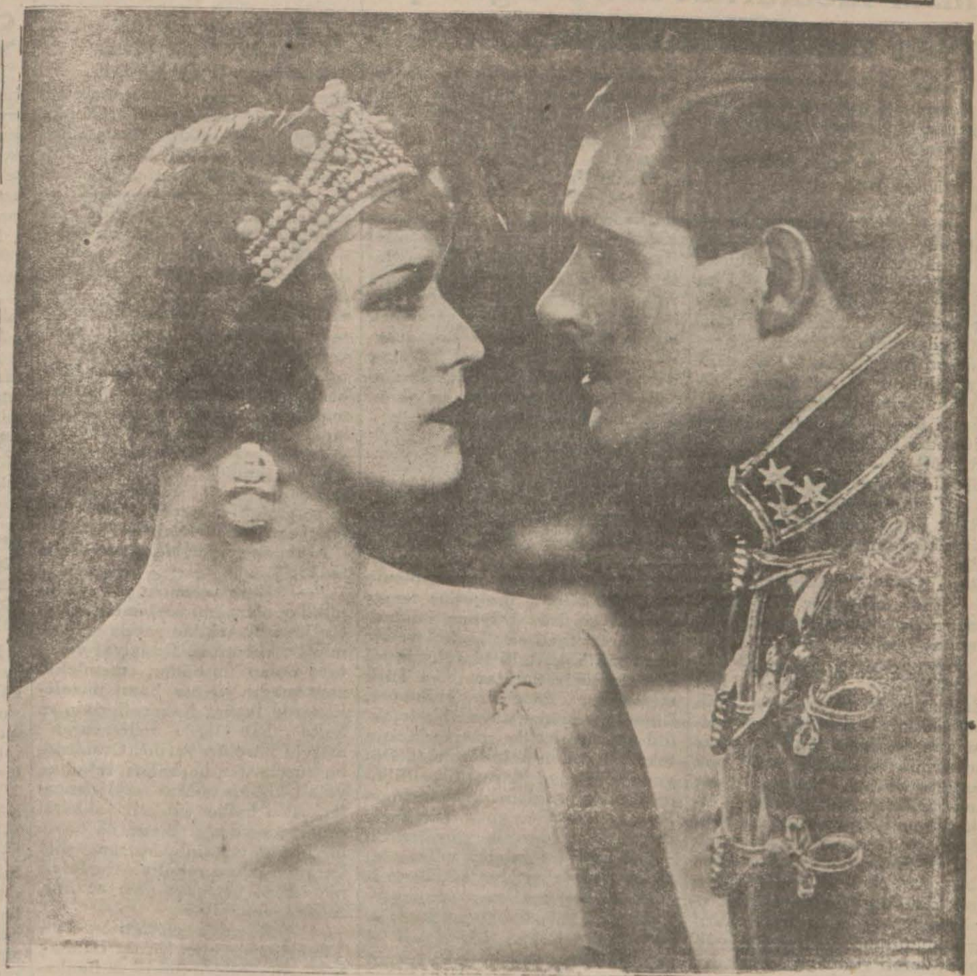
(Aşk ve asalet) filminden bir sahne...

Bir ihtiyar büyük baba, bir akterisle evlenmek isteyen toruna nuna elli sene evvel kendi başından geçmiş ve hüsrarla neticelenmiş olan bir akteris as-