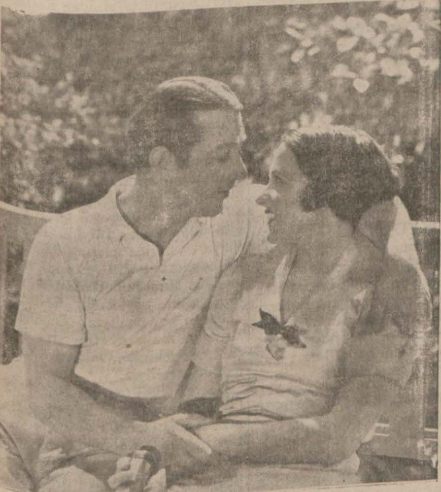
Daha ölmedin mi? filminden

Melek — Solgun Güller (Çarşambadan beri) Gloria — Aşk ve Asalet (Cumartesten itibaren) Majik — Sally (geçen perşembeden beri)