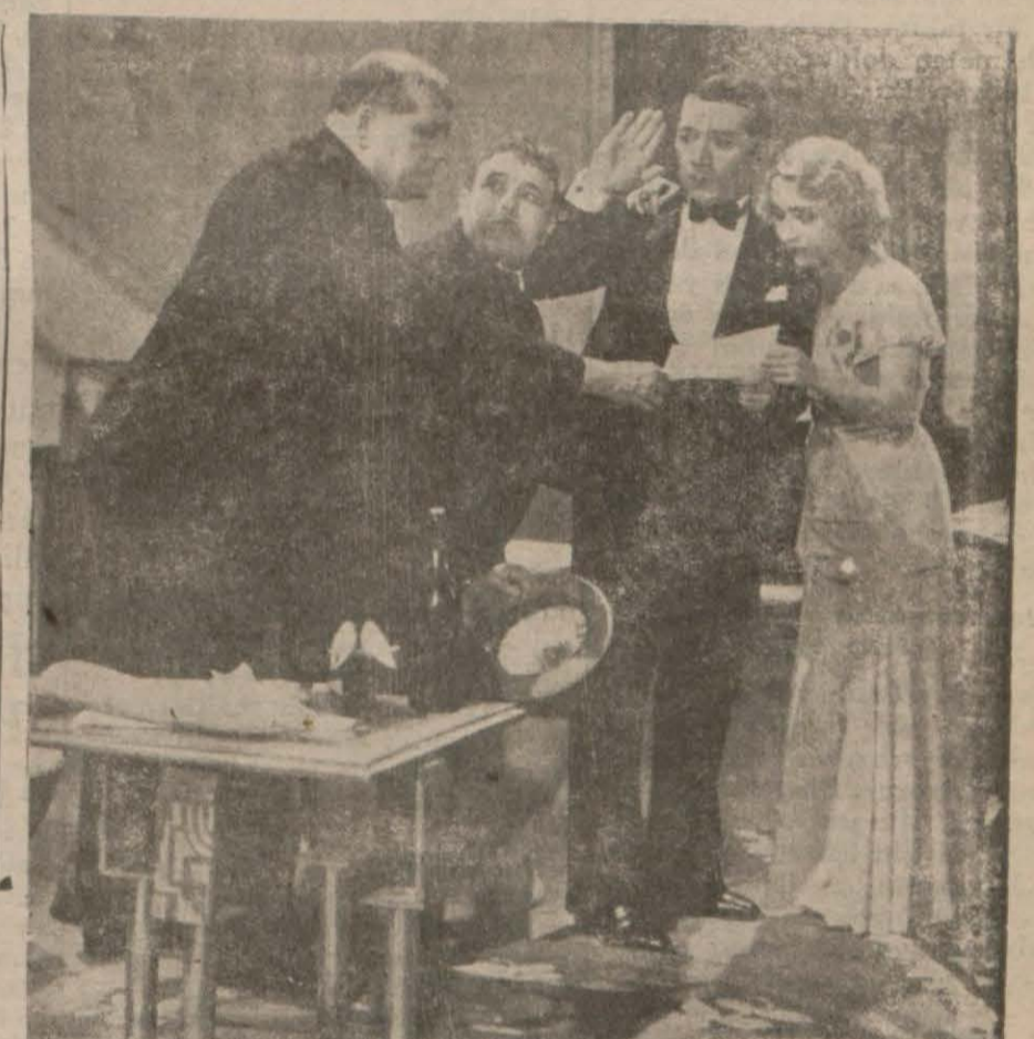
Daha ölmedin mi? filminde Noel... İvoei...