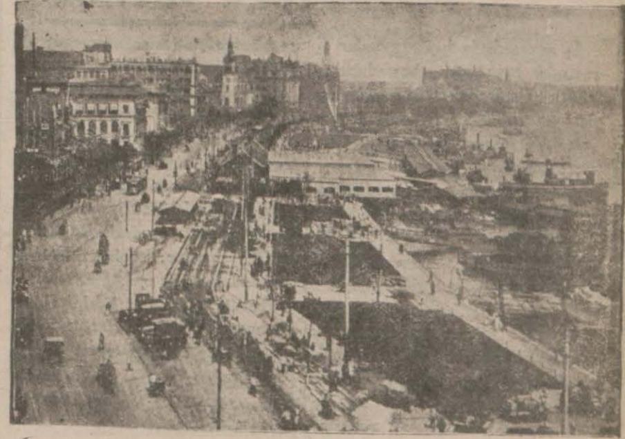
Şanghai limanına umumi bir nazar..

Dünkü içtimamı ziyaset eden Edirne meb'usu Şakir B. getirilmiş ve mezkûr sene şirketi-