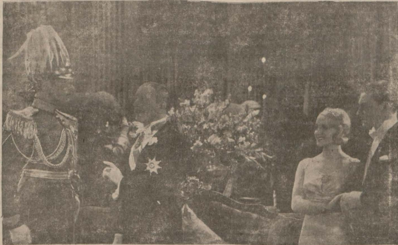
Kral eğleniyor filminden bir sahne

Bu film bir melodramdır. Seyircive alâka tevhit edecek