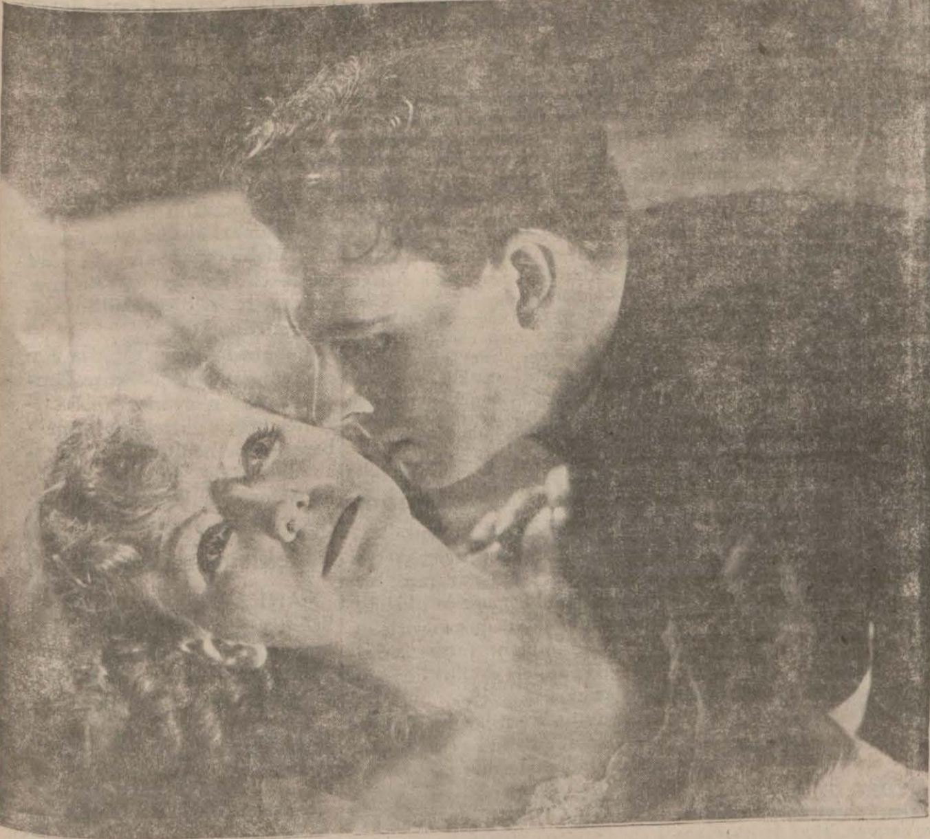
Greta Garbo (Romance) filminde