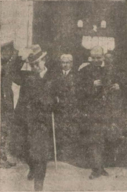
Tefik Rüşü B. istasyondan çıkıyor