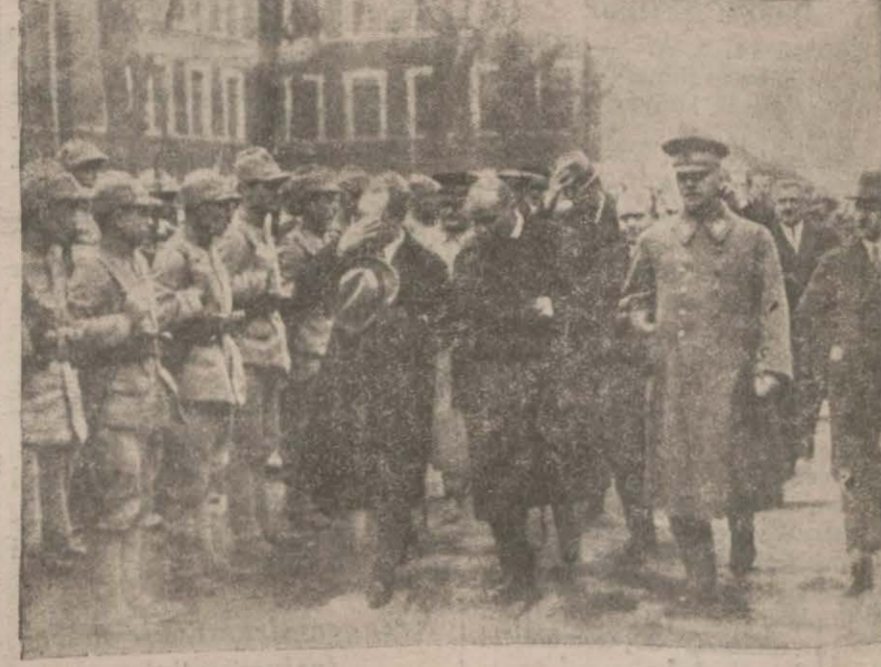
Hariciye Vekili Tefik Rüşü Bey Sirkeci istasyonunda...