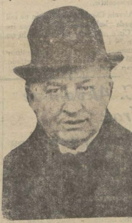
Mübadele komisyonu reisi

Muhtelit Mübadele komisyonu heyeti umumiyesi dün umumî bir celse aktetmiştir. İçtimada Şili'nin Peru sefirliğine tayin edildiğinden dolayı ya-