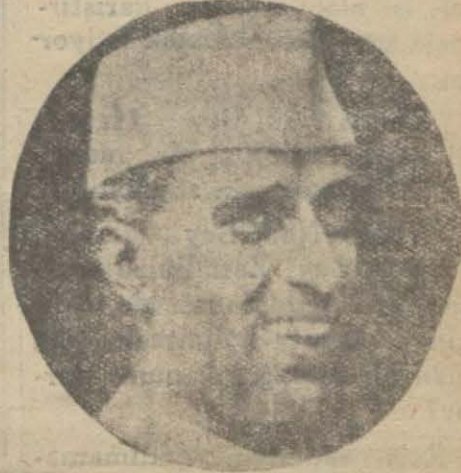
Tevkif edilen Hintli liderlerinden Pandit Nehrü

BOMBAY, 5 A.A. — Hint birliği kongresinin silâhsız itaatsizlik i-