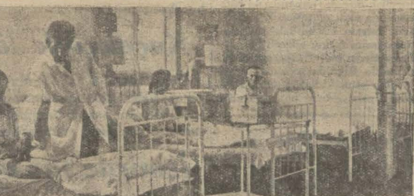
Fakülte hastanesinden bir intiba