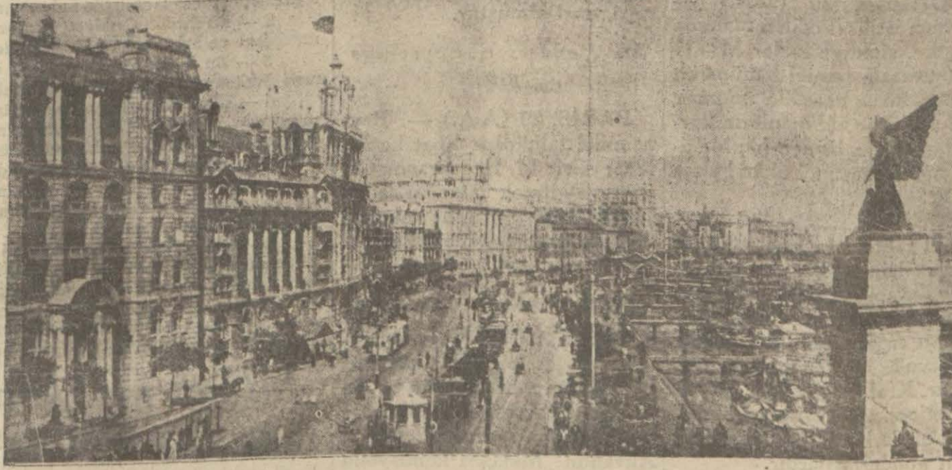
Changhai'da cenabilerle mahsus imtiyazlı mntakadan bir kısım