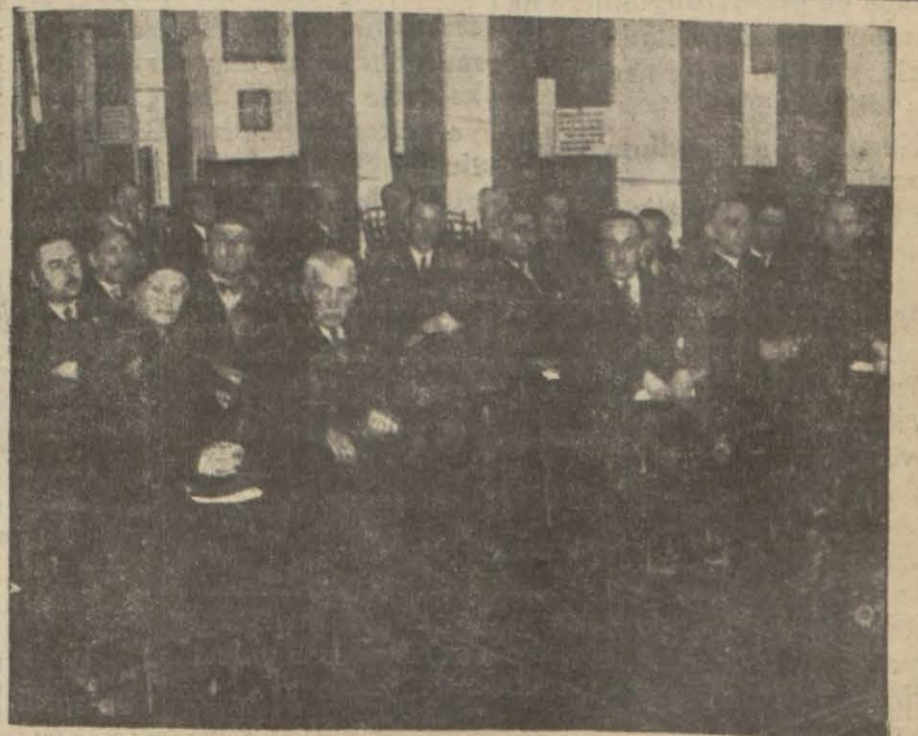
Veremle mücadele cemiyetinin dünkü içtimaı