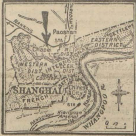
Changhai'de cenabilerin imtiyazlı mntakaları ile Çinlilerin buldukları yerler [Ok işareti Japonların girdikleri ve hâlinin vukua geldiği Chapei mntakasını gösteriyor]

.. [Aksayı Şarktan gelen haberler Çin - Japon münasebatının hâd bir sathaya girdiğini bildirmektedir. Şimdiye kadar ihtilâl Mançurya'ya ait idi. Bu ihtilâlin Çinliler arasında doğurduğu hisler nihayet Şanghai'da bazı Japon tebaasına karşı tecavüzlere müncele olmuştu. Japonya bunun üzerine tebaasına karşı yapılan tecavüzlerin taminini talep eder bir ultimatom tevdi etti. Ultimatomda mütecavizlerin tevki, tecavüze uğrayan tebaaya tazminat itası ve Japonya aleyhine propaganda yapan cemiyetlerin dağılması vardı. Ultimatomu alan Şanghai Çin hükümeti, Japonya'nın bütün metalibatını kabul edeceğini, fakat Japon aleyhtarları cemiyetleri dağıtmak mümkün olmadığını bildirdi. Ultimatomun müddeti geçen perşembe günü akşamı hitam bulduğundan Japon askerleri harekete geçmişlerdir. Aksayı Şark vaziyeti Amerika ile Japonya münasebatını gerginleştirmiştir. Her halde bu hâdise tevessü etmek istidatını göstermektedir. Aksayı Şark hakkında gelen son haberler şunlardır:]