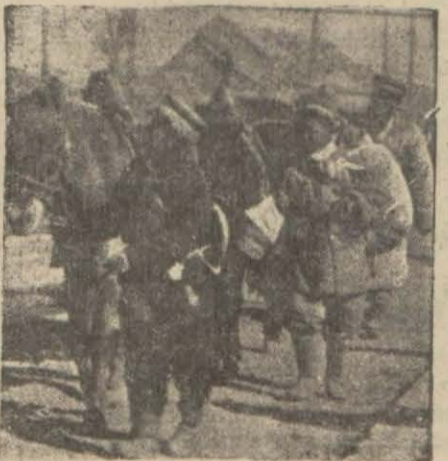
Gin ordusundan bir kol

CHANGHAY, 29 (A.A.) — Japon kuvvetleri başkumandanı saat 4,25 te Changhai'nin Çin mntakası olan Chapei'nin tayyarelerle bombardıman edilmesine emir vermiştir.