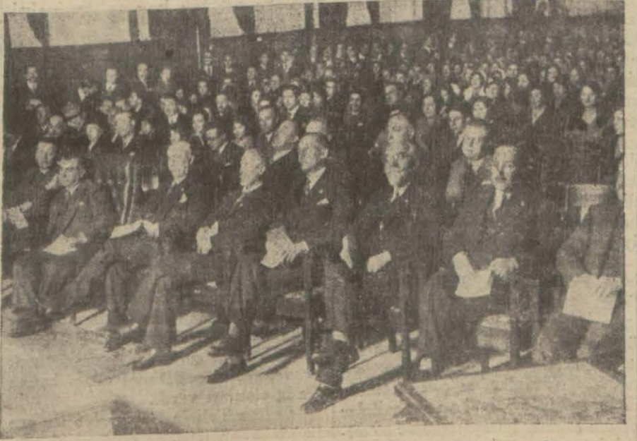
Murahaslar Galatasarayda verilen müsamerede

Kosey'in dünkü içtımında akalliyetler işi münakaşaları mucip oldu