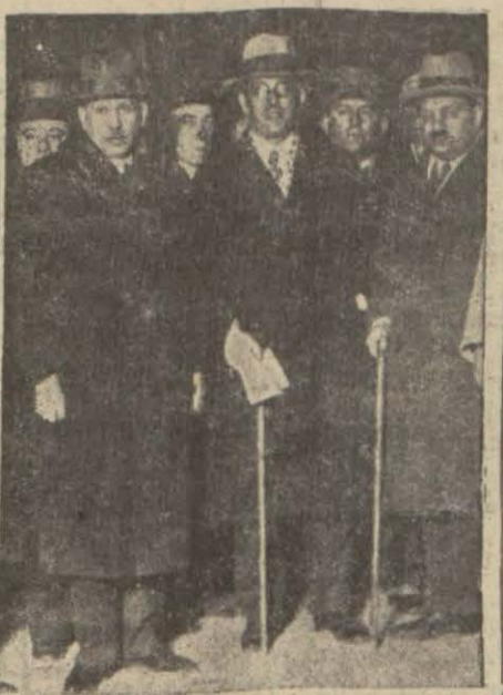
Murahaslarımız trenin hareketinden evvel

Yangın imtiyaz mntakasını tehdit etmektedir. Binlerce Çin askeri Nankin'den Şanghai'ya gelmektedir. (Devamı 2 inci sahifede)