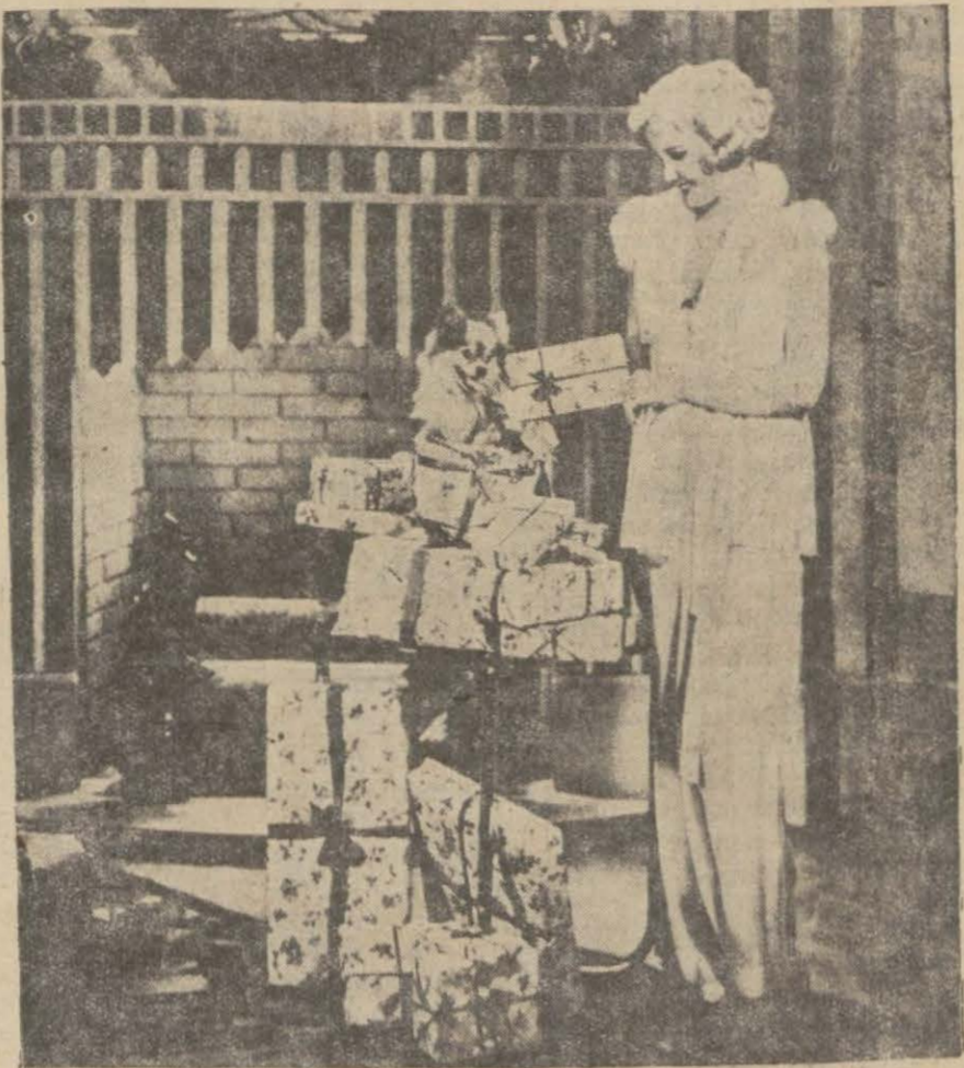
Sene başında hediye teatisi güzel âdetlerdendir. Unutmamalı ki, küçük hediyeler büyük dostlukların zarif bir ifadesidir ve dostluğu kuvvetlendirirler.

Yeni sene başı her kesin uğurlu gitmesini temenni ettiği bir gün olduğuna göre, bir nevi bayram sayılır.