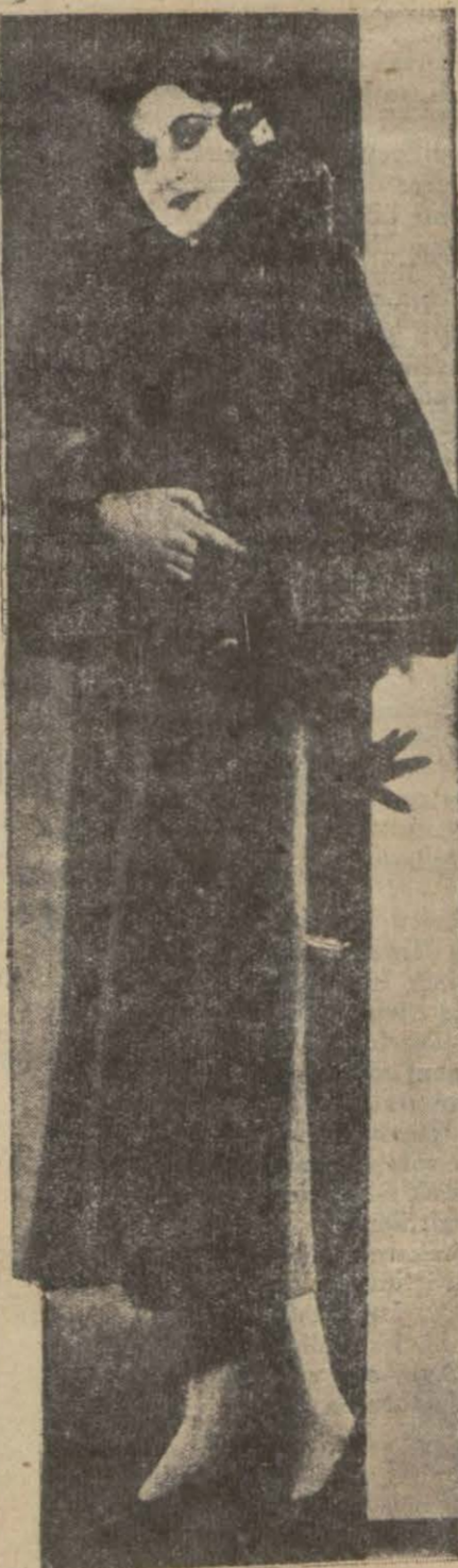
Bu sene astrakan modadır. Vakta kürk eski haşmetini kaybetmiş de- ğilse de, iktisadi buhranla giren sene içinde her kesenin kârı de- ğildir. Buna mukabil astrakan daha ucuz olmakla, mantolarda kürkten daha zarif durmaktadır.