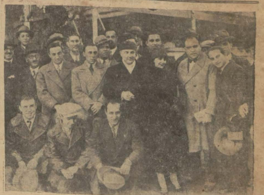
Dün Atınaya hareket eden sporcularımız

"6" rakamı ile biten bütün numaralar yüzler lira amorti kazanmışlar. (Diğer kazanan numaralar halinde altıncı sahifemizedir.)