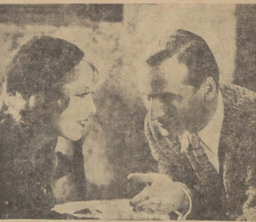
"Anni şoför" filminden bir sahne