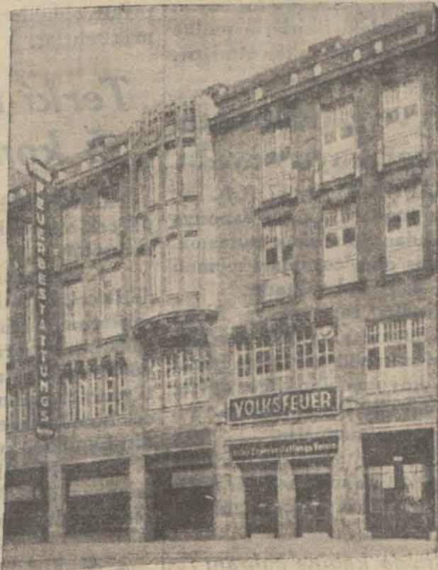
Almanyadaki müessesenin merkezi