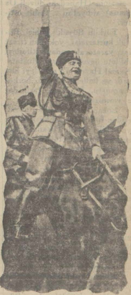
İtalya Başvekilî M. Mussolini

Bu haberler içinde M. Mussolinin de yazdığı bir makalenin hülâsasını vardır. Gerek bu mühim makalede gerek diğer neşriyat dünyaya milletleri arasındaki derin, ızdıraplı sıkıntı ve ihtilâflara işaret etmektedirler. Fakat hiç bir zaman bunlarda bir iki gündün beri mûsanna ve müheyyiç haber neşretmeyi âdet eden ve efkârı umumiyeyi yanlış istikametlere sevkeden gazetelerin görüldüğü ve göstermeğe çalıştığı yakın ve başbaşa kalan bir harp tehlikesi yoktur.