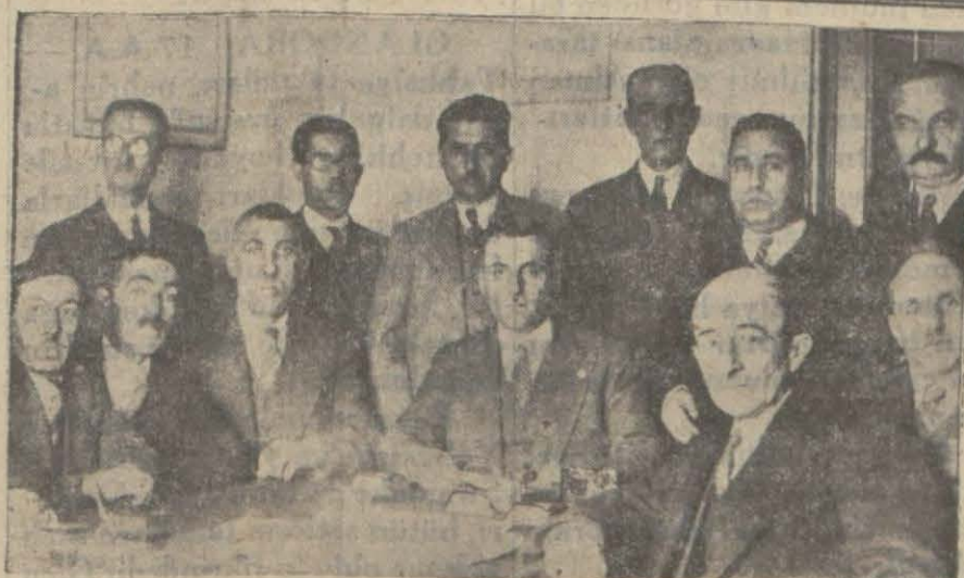
Tayyare Cemiyeti merkezinde dün bir içtima yapıldı ve sadakai fitir ve zekât meseleleri görüşüldü..

Bu elim ziyadan dolayı merhumun kederinde ailesine taziyetlerimizi ziyâ beyan ederiz.