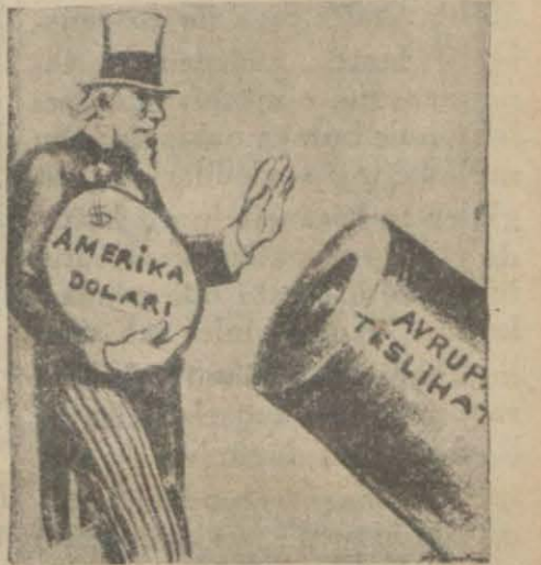
Amerika — Yool! Bu deliğe bir rakamam!