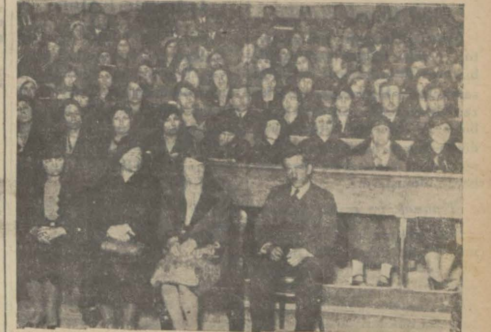
Muallimlerin dünkü içtima