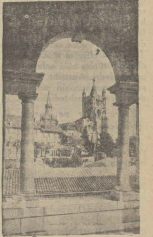
Konferansın toplanacağı Lausanne'dan bir manzara

LONDRA, 15 (A.A.) — Şimdi (Devamı 5 inci sahifede)