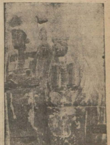
Beş bin senelik mumyalar

Ziyaretçilere bir kolaylık olmak için üzerlerine bü-