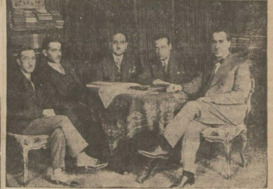
Dün sabah toplanan hususî mektep müdürleri

Yarın saat 16 da müzakereye devam edilecektir.