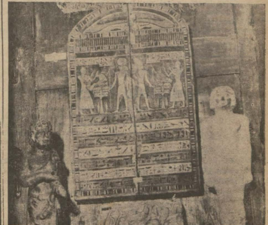
Dün açılan Mısır salonundan bir köşe..