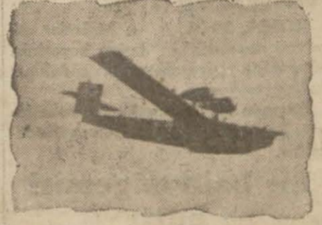
inde bulunan iki Amerikalı iki pilot ve bir malkinist Yeşilköyde yerleşmişlerdir.