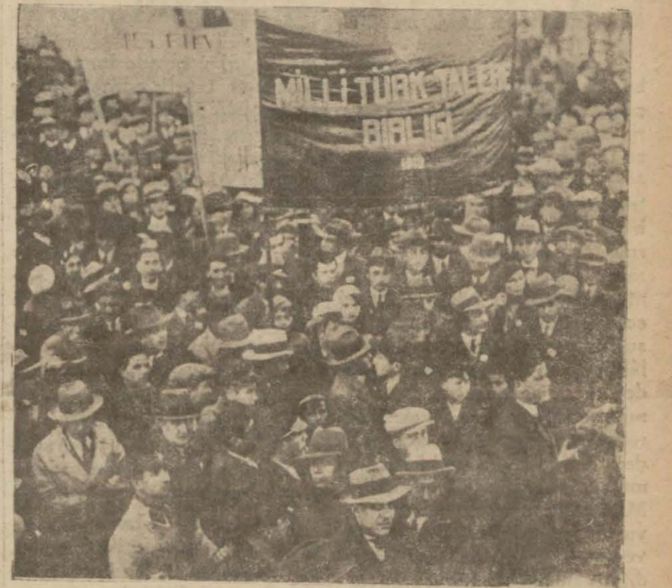
Yüksek mektepler ve use catedesi yürüyüş halinde