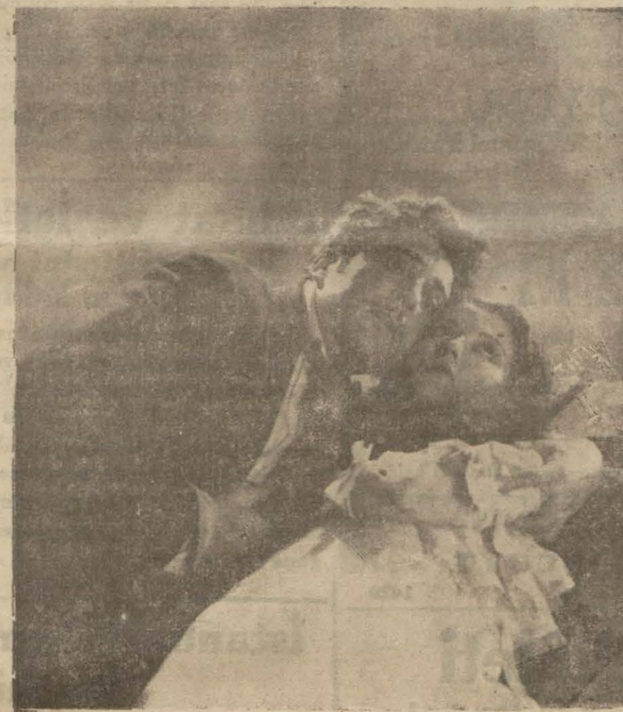
"Morg sokağı cinayeti", filminden bir sahne