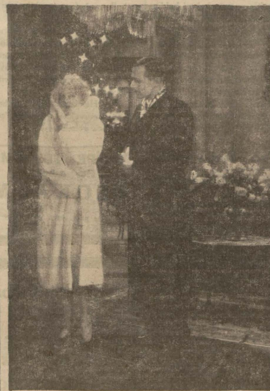
Artistik'te Kiki filminden bir sahne

şekil etmiş beklemektedirler. Kiki, istihkâmârâne, gözlerinin içi sabredemez aralarından sokuştur, içine bakan bu kızdan o kadar