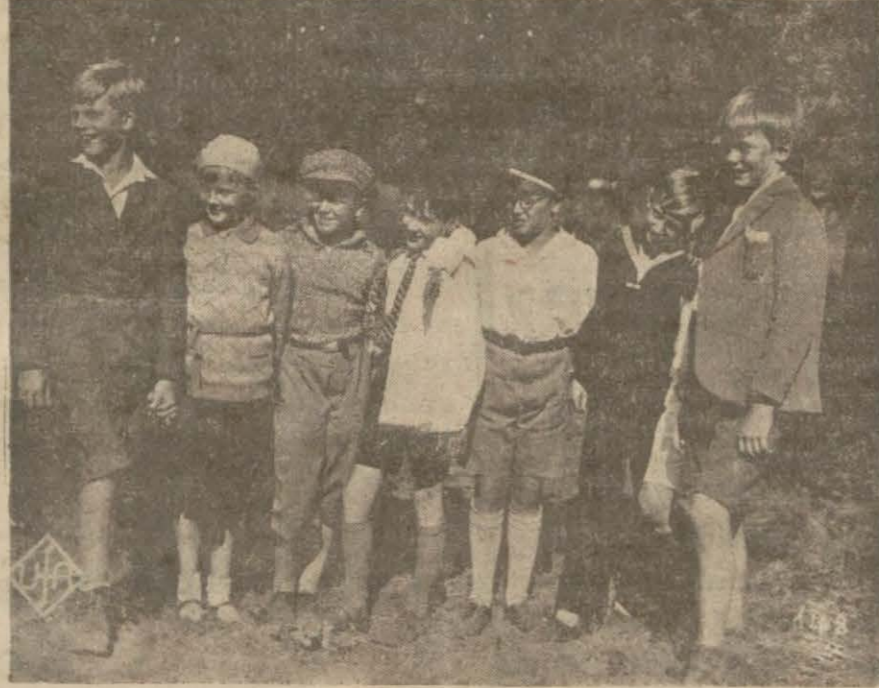
Majikte gösterilen ve artistleri çocuklardan mürekkep filminden birkaç sahne