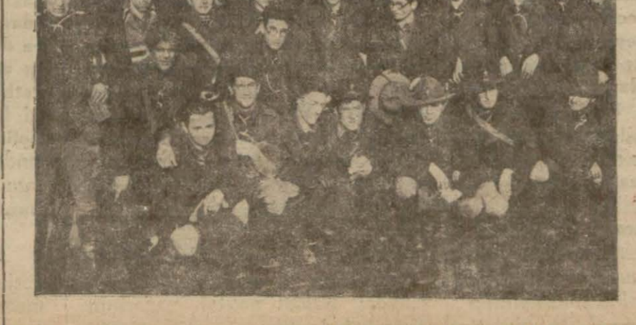
Dün sabah Galatasaray lisesi izcileri Atınaya giderlerken