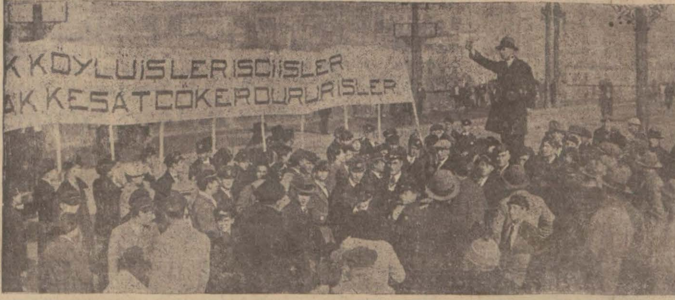
Talebe köprü başında tasarruf lehinde tezahüratta bulundu