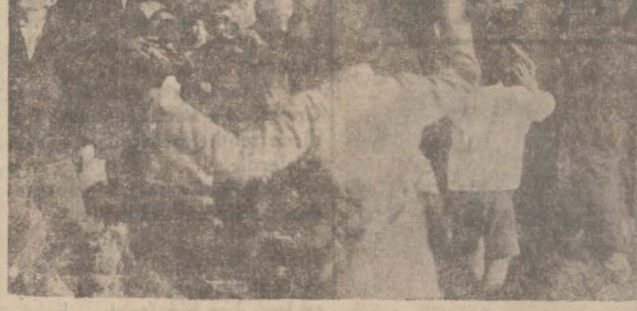
Tayyarelerin attığı hediyeler kapılıırken.

Adres: İstanbul, Bahekapu Taş Han No. 20 - 21. Telefon: 20307.