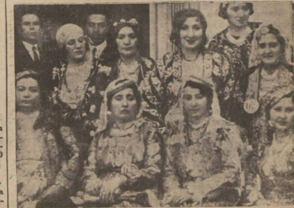
Ankarada Himayeletfalın verdiği kostümlü baloda..