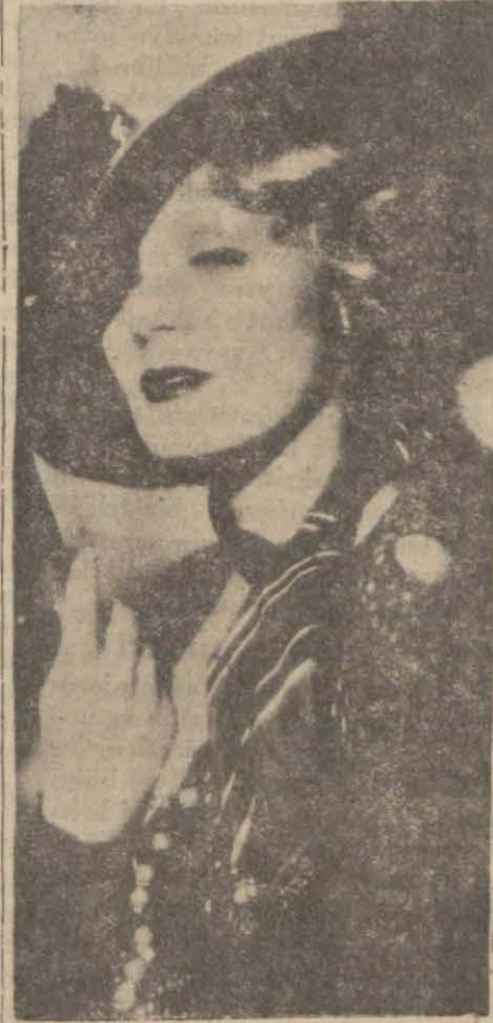
"Sarıştın Mabude," filminde Marlene Dietrich

Bidayette bir mülakatçıya serzenişte bulunmuştum. İstihbarat ver-