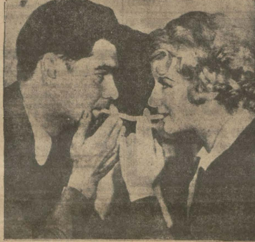
Bir çok sessiz filmler çevirmiş olan İsveçli artist Greta Nissen amerik... stüdyolarında bu defa sefil filme başlamıştır. Greta Nissen bir kaç sene sinema âleminde çekilmiş ve İngilizceyi mükemmel konuşmaktadır. Greta geçenlerde Veldon Hoburu isminde bir jönpromye ile evlenmiştir. Resim evlileri gösteriyor.