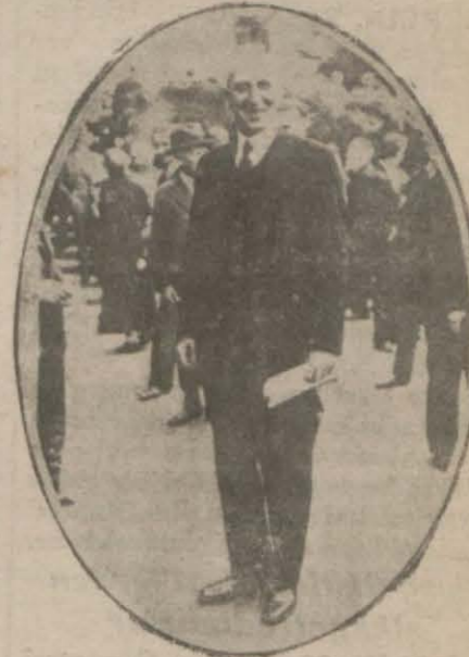
İngiliz Haricte nazırı Sir John Simon konferanstan çıkarken

Fransızlar tarafından ileri sürülen bir teklif şudur: Alman (Devamı 5 inci sahifede)