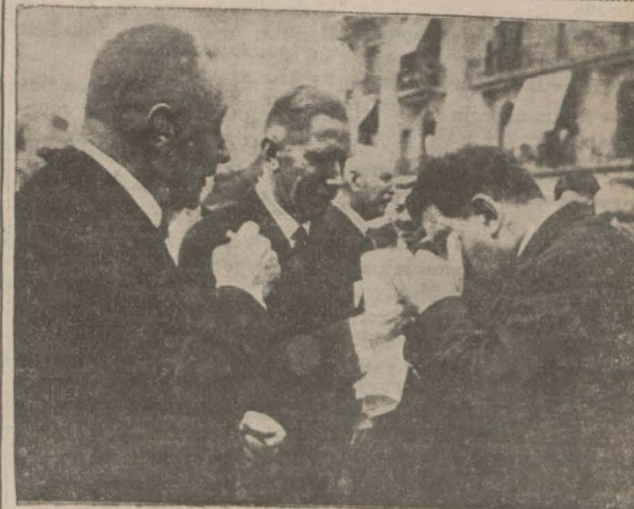
Konferans intibaları: Alman Başvekili Von Papen Fransız Başvekili M. Herriot'un çiğarasını yakıyor

İZMİT, 28 A.A. — İzmitin kurtuluş bayramı büyük tezahüratla tes'it edilmektedir. Akşam fener alayları yapılacaktır.