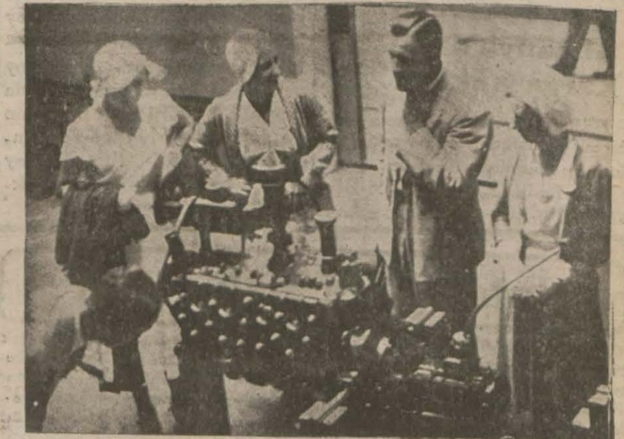
Hanımlardan bir grup, otomobillerin maktne aksami hakkında verilen izahatı dinliyorlar

Müessese şefleri 8 silindirli yeni arabaların vasıf. larını nasıl izah ediyorlar?