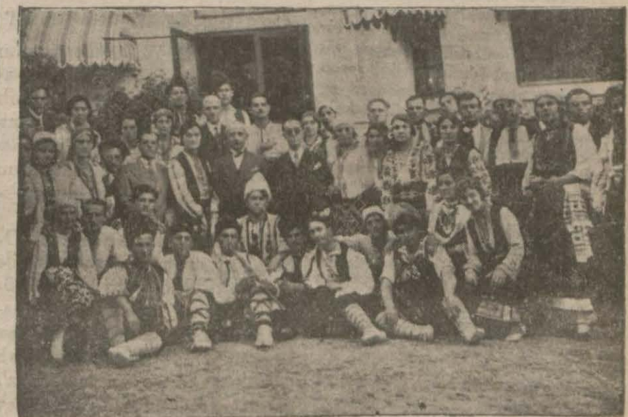
Misafirler Ankarada Başvekillin etrafında

Bulgar amatör balet heyeti bu gece bir temsil verecek