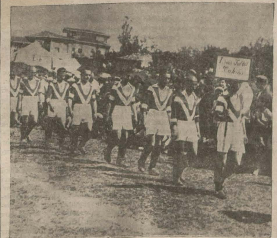
Federe olmayan kulüplerin dünkü geçit resminden bir intiba.

gözü Cenevreye, betahis Fransız heyeti murahasasına çevrilmiştir. Şimdi Fransız heyeti ile Amerikan murahasaları arasında mükâlemeler daha sıkı bir hale gelmiştir. Umumi intiba bir az müsait gibi görünmekle beraber ileriki içtimalar da Hoover teklifinin mükâbil tezlerle çürütülmek istenilip istenilmeyeceği malûm değildir. Bu mesele-