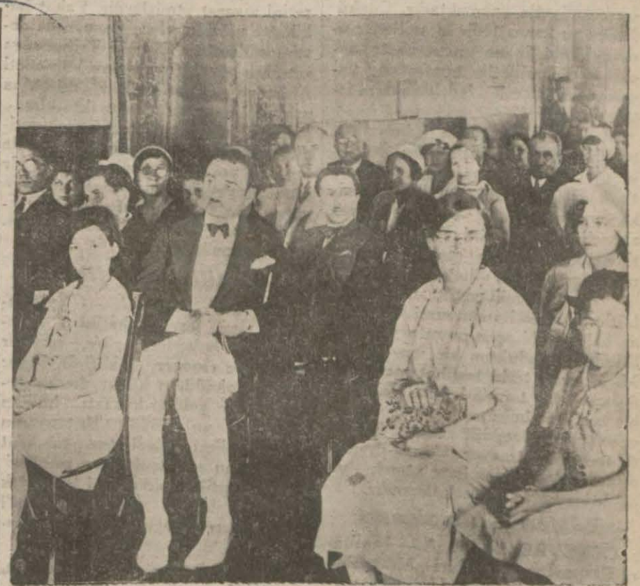
Halkevinde dünkü merasime gelenler

Halk fırkası umumî kâtibi Recep.B.ın şayanı dikkat nutku son haberlerimizdedir.