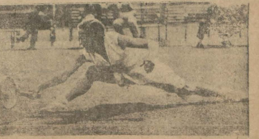
Tenis'in atletik bir oyun olduğuna güzel bir misal