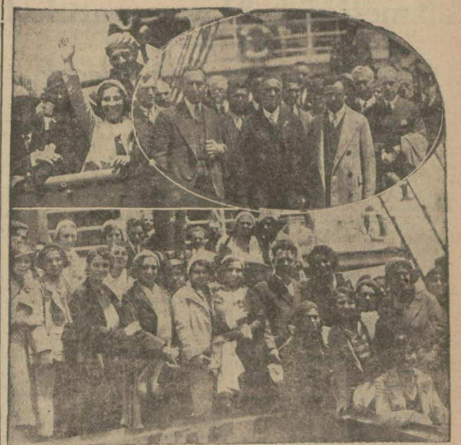
Bulgar gazetecilerle artistleri vapurda ve rıhtımda

ANKARA, 14 (Telefon) — Nahiye müderrislerinin hayvan yem bedellerinin ilgası hakkında bir kanun lâyihası hazırlanmıştır.