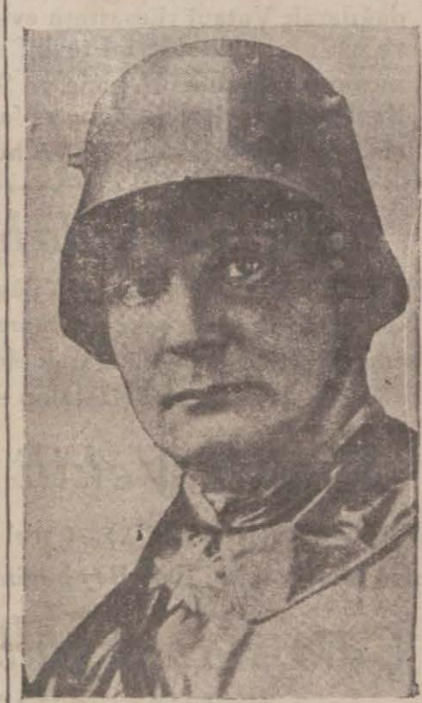
Reichstag meclisi reisi Kapiten Goehring

Fransızlar Almanyayı İmparatorluk Almanyasından farksız görmeğe başladılar