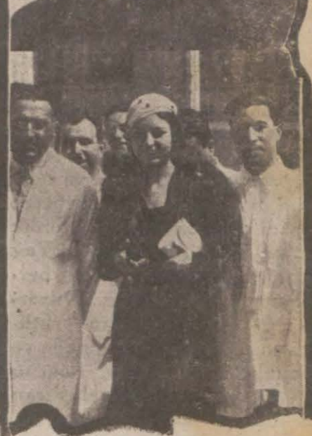
Dünya güzelli hastane heyeti şhhiyesi ve yeğeni ile beraber

Dünya Güzeli Keriman Ece, dün sabah peder ve validesi refakatinde Fındıklı Apartmanından çıkarak bir otomobile Cerrahpaşa hastahanesinde tahtı tedavide bulunan yeğeni Sait Beyi ziyaret etmiştir. Keriman Ece,