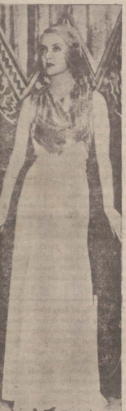
Bette Davis "Zenginler bizim taraftadır,, ismindeki filminde..

Fakat söylendiğine göre, Şarlot artık eski fikrinde değildir. Sesli filme karşı mücadelesine nihayet vermiştir. Unut mamalı ki Şarlot, artist olduğu kadar büyük bir iş adamıdır.