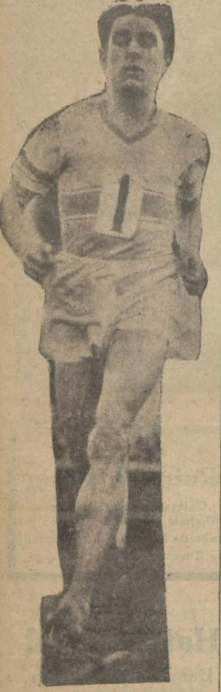
Her şeye rağmen dünyalık olan meşhur Ladumegue