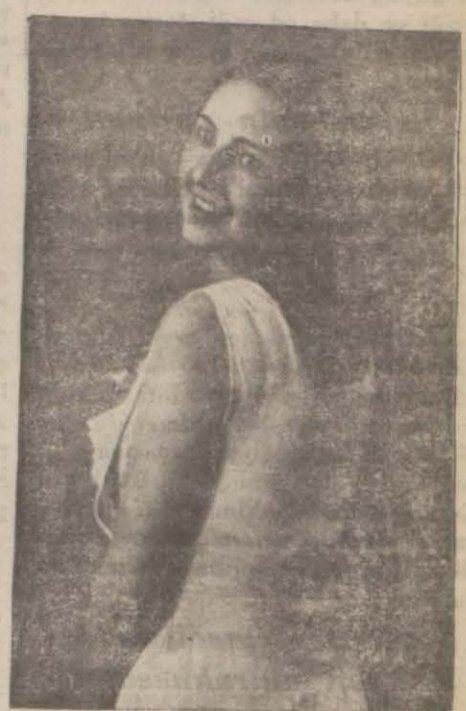
Keriman Halis H.

Bundan sonra Peyami Safa B. Eceye bir buket takdim etmiştir. Kraliçe geç vakte kadar ailesiyle birlikte bir masada oturarak numaraları seyretmiştir.