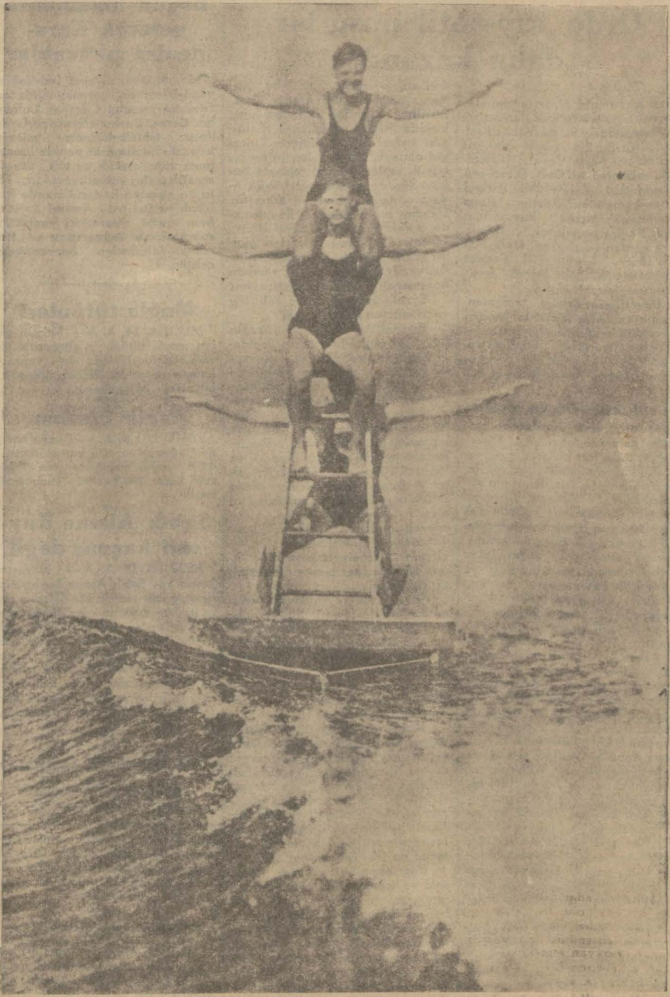
Avrupada deniz mevsiminin sonu dolayısıyla: Saatte 50 kilometre süratle giden bir motörün arkasında insandan bir merdiven

mine olmuştur. Bunu elimine eden de Yunanlı Papadopoulos'tur. Diğer oyunların çok güzel ve enteresan olacağı bedihidir. Bundan sonra pazar günü Yunanistan double ekibi ile Türkiye'nin double ekibi hususî bir maç yapacaktır. Bu maçın sonra yine aynı günde Fenerbahçe kulübü ile Sofya tenis kulübü bir tenis maçı yapacaktır. Yalnız Fenerbahçe kulübü millî tak-