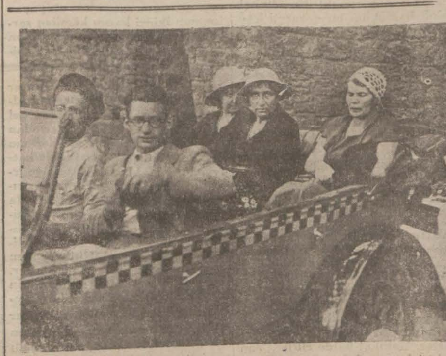
Dün şehrimize gelen ve müzeleri gezen Fransız seyyahlarından bir grup otomobilde

Hükümet 2051 numaralı kararlar çay, şeker ve kahve ithali işlerini bir elden idare edecektir. Bunun için şimdiden tedbir alınmaktadır. Memlekete ihtiyaçta fazla verilen bu maddeler serbestçe ithal olunurken hükümet bu maddelerin bir elden idaresi için hazırlanmaktadır. Bu itibarla tacirlerin zarara gir memeleri için mutayakkız olmaları lâzım gelmektedir. Ticaret odası Vekâletin tebliğini derhal tacirler tamim etmiştir. Bir çok tacirler odaya müracaatla fazla izahat istemektedirler.