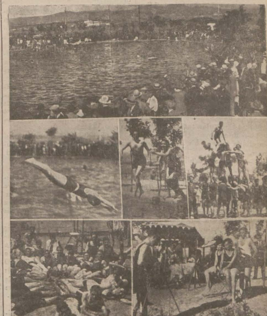
Bu resimdeki deniz eğlencelerini görenler ilk bakışta İstanbul plajlarından muhtelif intihaplar tesbit ettiklerini zannına düşerler. Halbuki bu plaj Ankara plajıdır ve ortalık Ankaralılar için deniz ve su hasreti yoktur. Ankara'daki bu mühim yeniliği ve değişikliği izah eden muhabirimizin mektubu 3 üncü sahifemizedir.

PARIS, 4 (Milliyet) — Dünya güzellik kraliçesi intihabına karşı Fransada gösterilen alâka eski hararetini kaybetmiştir. Fransız gazetelerinin dünya güzellik kraliçesine sütunlarında tahsis ettikleri yer, iki üç satırı geçmemektedir. 1 Ağıstos'tan 4 Ağıstos'a kadar, Pariste çıkan bütün gazeteleri aldım. Hepsini ayrı ayrı tetkik ettim. Bunlarda güzelimize ait tafsilât aramanın tamamen bey hude olduğuna kanaat getirdim. Bazı gazeteler, hattâ müsabakada bahis bile etmeğe lüzum görmemişlerdir. Diğer kısımları da sadece Spa'da, bir güzellik müسابakası tertip edildiğini ve Keriman Halis Hanımın dünya güzellikliğine intihap edildiğini haber vermekle iktifa ettiler. Öteden beri güzellik müsabakaları fazla meşgul olur gibi görünür. İntransigent ve Matin gazeteleri, ötekilerinden biraz daha fazla tafsilât veriyorlar. Fakat bunların da yazdıkları azami 15 - 20 satırı geçmiyor. Tuhaf değil mi? Belçika (Devamı 4 üncü sahifede)