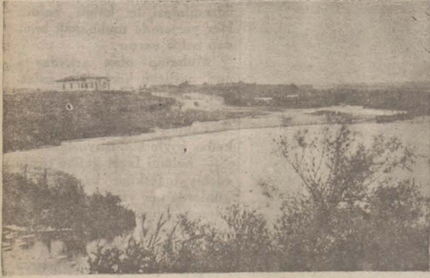
Hayreboludan bir manzara

Peynirin bu en meşhur yerine satılık peynir gene İstanbuldan mı gidiyor?