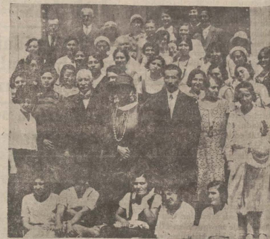
Mtsafir talebe Çapaaa

Birkaç gün evvel Fransanın Aix en Provence şehrinden şehrimize gelen 40 genç kızdan mürekkep kız muallim mektebi talebesi bugün Suriye ve Mısra gideceklerdir. Cuma günü gelen Roman Darülfünun talebesi de dün Köstenceye gitmişlerdir.