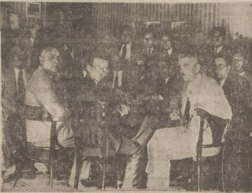
Fabrikatörler dünkü içtimada

Yeni kontenjan kararnamesile memleketimize yapılacak her nevi ithalâtın kontenjana tabi tutulması, bu suretle fabrikalara lüzumu olan mevaddı iptidaiyenin de kontenjan dahiline girmesi sanayi üzerinde müessir olacaktır.