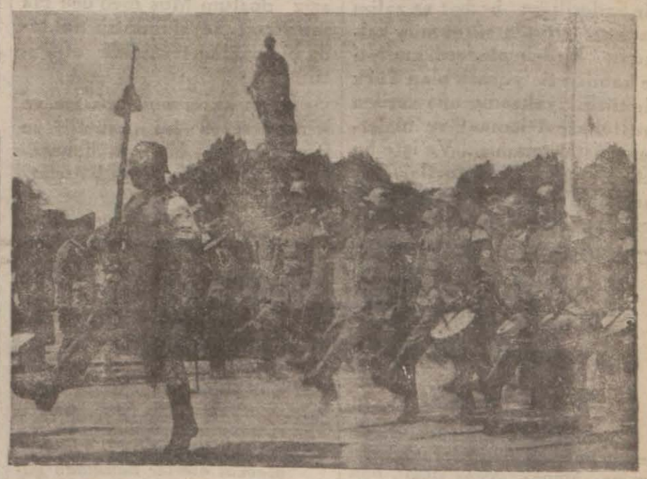
Hitlercilerin şiddet hareketlerine karşı daima seferber tutulan cümhuriyeti muhafaza taburlarından biri

Benzin fiatlarının sebepsiz yük seltildiğini aylardan beri yazdığımız halde, alâkadar makamlar tahkikatı girift yollardan sevk ve idare ettikleri için, göz önündeki bir hakikatın tecellisi aylarca sürdü ve bu müddet zarfında da şirketler gene istedikleri fiattan benzin sattılar ve hâlâ satıyorlar. Ni (Devamı 6 ıncı sahifede)