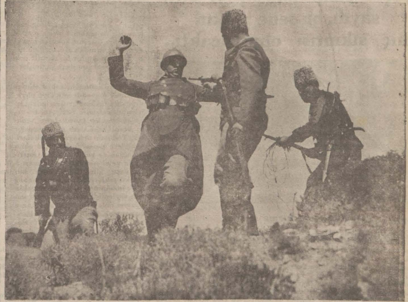
Gazi Hz.nin nutuklarından alınan ve bir çok kahramanlık sahnelerini gösteren bu film Çanakkalede Akbaş mevkinde çevrilmeğe başlanmıştır. Resim cephaneliği muhafaza eden bir düşman neferinin teslim olduğunu göstermektedir.