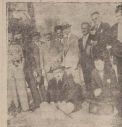
Encümen azası tarlalarda

Tütün İnhisarı kanununda t.dilât icrasına memur encümen, dün de İnhisarlar idaresinde toplanarak mesaisine devam etmiştir. Encümen, şimdiki kanunun ziraat işlerine ait fasılların müzakeresini bir haftaya kadar bitirecek alm ve satma müteallik maddelerine gelecektir.