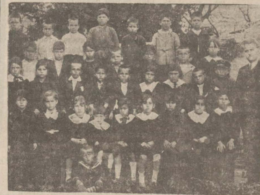
Şarköy İkinci mektep ikinci sınıfı

SARKÖY: — Her kazada olduğu gibi Şarköyde de tesettür ve taassup fazladır. Buranın sokaklarında kadınlara tesadüf edilememektedir. Eski âdetten yavaş yavaş vazgeçmek lâzım iken her nasılsa cesaret edenler olmuyor. Bu kabahat ise şüphesiz ki erkelerimizdir. Binaenaleyh onlar da bu cereyan-ergü uyacaklardır. AHLAK ve SEVİYE Şarköyde az çok işret ve kumar vardır. Kasabın münevver sınıfları birbirlerini çekemediklerinden daima ayrılık halindedirler. Bu ayrılık kırkacılık mahiyetini aldığı ve fakat hükümetin siyasetine taalluku olmadığını ve kendi aralarında post kavgası yapmaktan ibaret bir hâdise olduğunu sonradan anladım. Serbest fırka zamanında burada ehemiyetli memktedir. Bir balya tütünün bir liraya satıldığı büyük bir teessüfle haber aldım. DETLER Seyrisefain vapurları buraya İstanbuldan doğru geliyorsa da avdetde Karabığa hattını takip edildiklerinden mevsiminde yetişen yaş rekolteler yollarda çürümeye mahkûmdurlar. Binaenaleyh motörlerle sevkiyat yapmak mecburiyeti hasıl olduğundan masraflar ziyadeleşmektedir. Geçen sene (300.000) kilo tütün satılmadığından ambarlarda çürümektedir. Bu ambarlarda 29 senesinin tütünleri de mevcuttur ve 5 kuruş tütünü kuruşa kadar bu eski mahsul tütünlerin kilosuna satılmaktadır! VAPUR ÜCRETLERİ PAHALIDIR Kazanın fevkalâde bir kuvveti