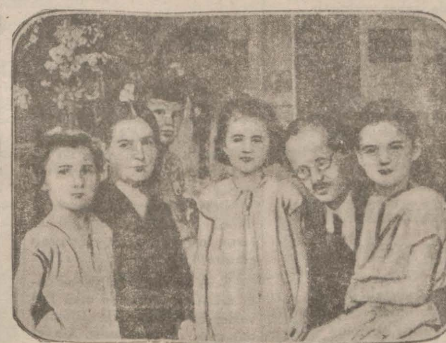
Profesör ve ailesi

— Allaha ısmarladık Mari, Allaha ısmarladık çocuklar! diyi bağırır. Biraz sonra, da ha henüz şafak atarken, balon yavaş yavaş yükselmeğe başladı. Geçen sene aynı balon pek hızlı çıkmıştı. Fakat bu sene balonun mün-kün olduğu kadar yavaş çıkmasını arzu etmiş ve ona göre hazırlık yapılmıştı. Filhakika balon, bütün azamet ve haşmetle yavaş yavaş yükselmeğe başladı. Profesör-