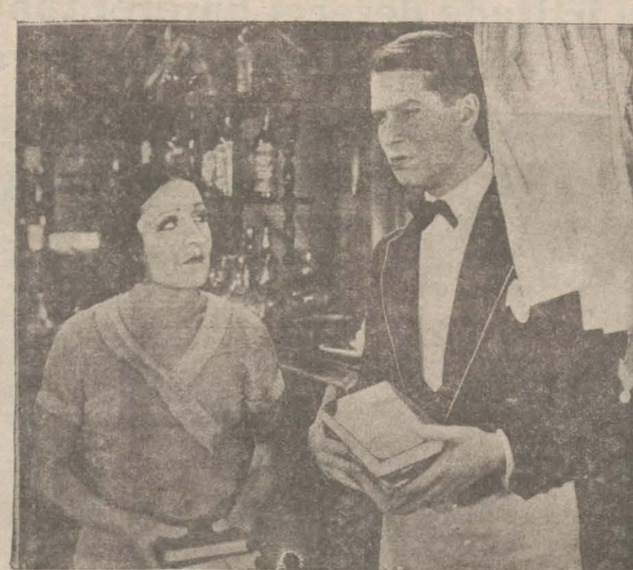
"Küçük kahve" filminde Yvonne Valle ve Maurice Chevalier

Maurice Chevalier'in karısı Yvonne Valle'den ayrılacağı tahakkuk ediyor. Şimdiye kadar sinema sanatçileri arasında talâk umuru cariyeden bir hale geldiği için bunda şaşılacak bir şey yok. Yalnız talâka sebep olarak Maurice Chevalier dostlarından birine şöyle demiş: — İyi arkadaş kalmak isteyecek yok. Maamafih kulaklamaya söylemişim göre, Maurice Chevalier muvaffakiyet-