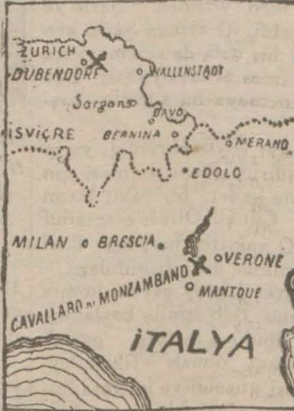
Yukarda X işareti balonun havalandığı, aşağıda X işareti indiği yer

rün başı delikte görünüyör. Bir kaç dakika sonra profesörün başı delikten içeriye çekildi. Bütün gözler gittikçe küçülmeğe başlayan balondan bir türlü ayrılmıyor. En nihayet balon küçük bir nokta haline giriyor ve sonra kayboluyor. Tabiatın sırrını öğrenmeğe çıkan bu iki a-