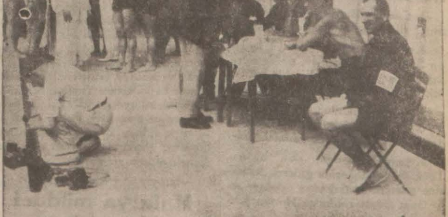
Yalova havuzlarındaki müsabakalardan bir kaç intibâ