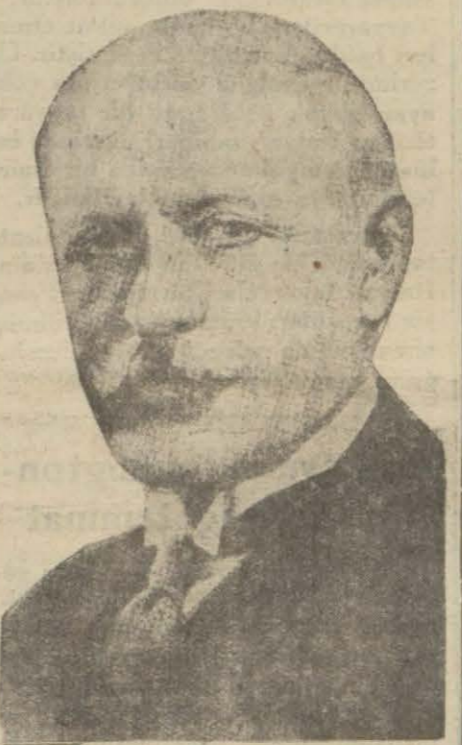
Ay sonunda Ankaraya geleceği bildirilen Bulgar Başvekil M. Mouchanoff

vada mecmuası bu ziyaret ve davetlere dair olarak şunları yazıyor: Başvekil M. Mouchanoff'un yakında Ankaraya yapacağı ziyaret (Devamı 6 ncı sahîfede)