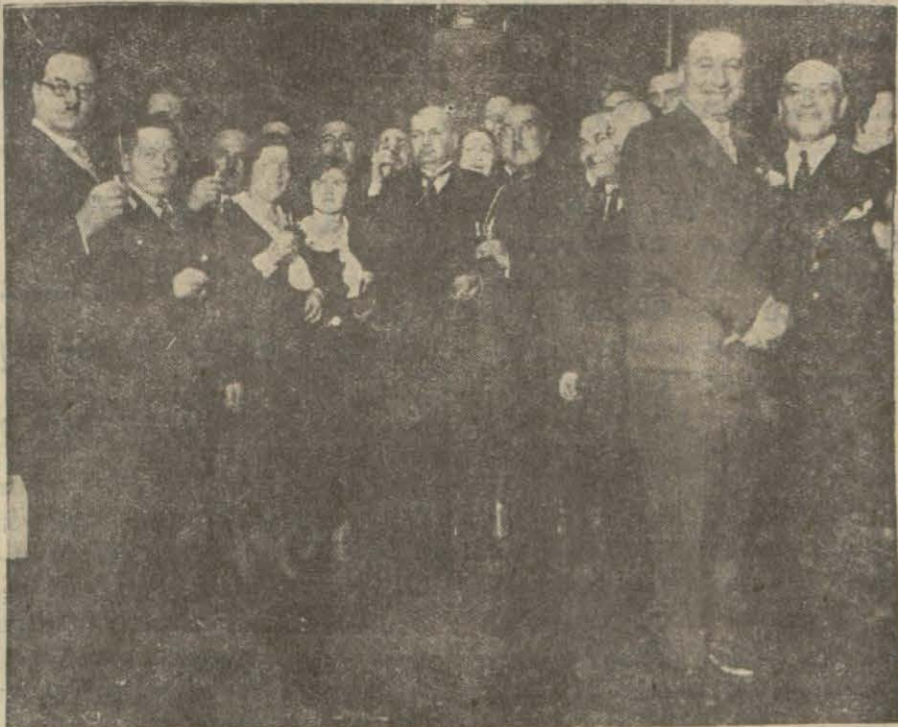
Rus Konsolosluğunda verilen çaya davetlilerden bir grup..

Dün şehrimiz Rus konsoloshanesinde Sovyet ihtilâlinin 14 üncü yıldönümü münasebetile mükellef bir çay ziyafeti verilmiştir. Ziyafet samimi ve parlak olmuş, davetliler zengin bir büfeden izaz edilmişlerdir.