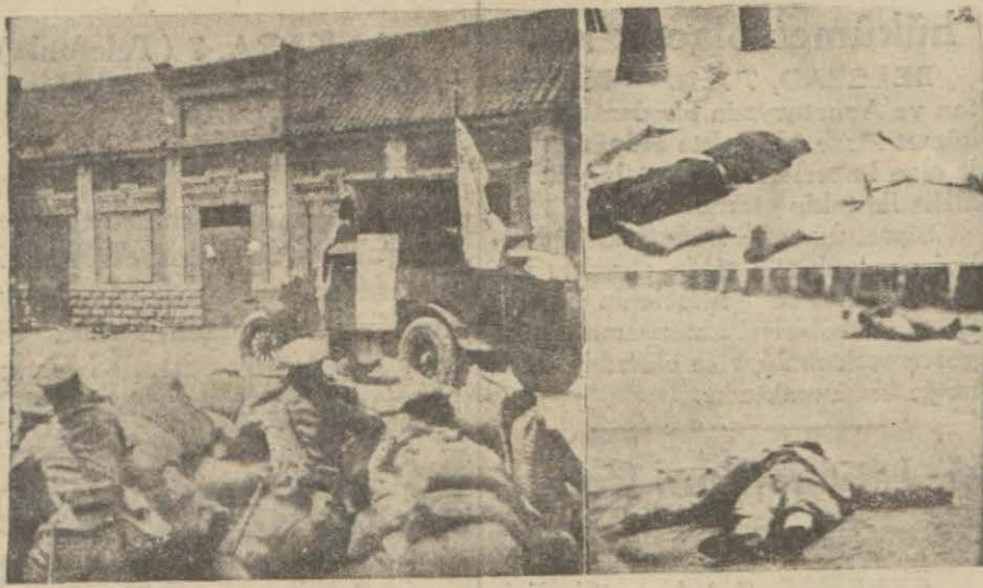
Çin sokaklarında ölümler ve mevzi alan Japon askerleri