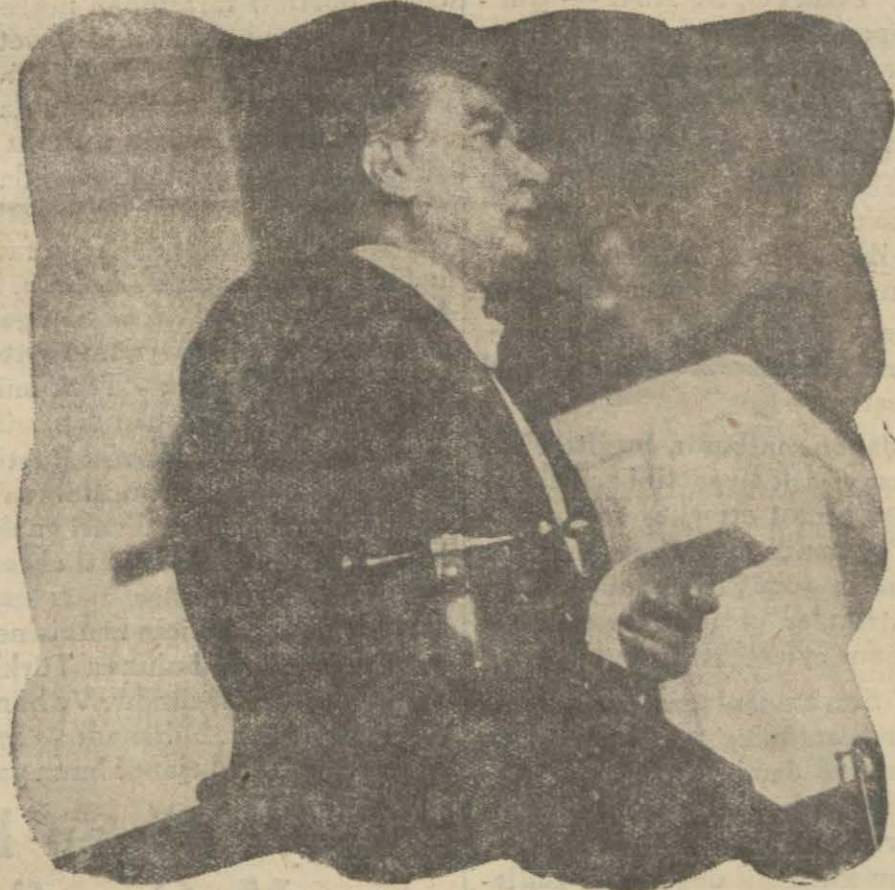
Reiscümhur Hazretleri iradî nutkederlerken

“Nefsimize ve millet kudretlerine itimat, hükümette ve siyasette istikrar, tasarrufta ve fedakârlıkta sarsılmaz bir karar, devletin dahil ve haricte emniyet ve sükûnete mazhariyeti; halin başlıca tedbirleridir,,