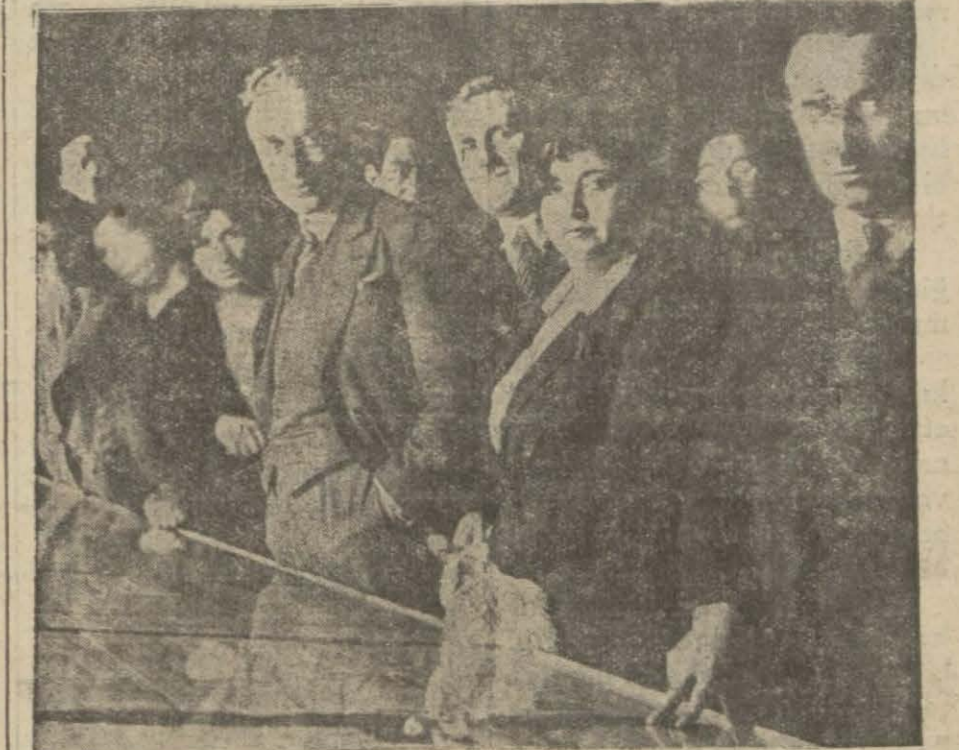
Matbuat sergisinin küşat resminden bir intiba..

malum merasim yapıldı... bizim takım şöyle idi: (Devamı 5 inci sahifede)