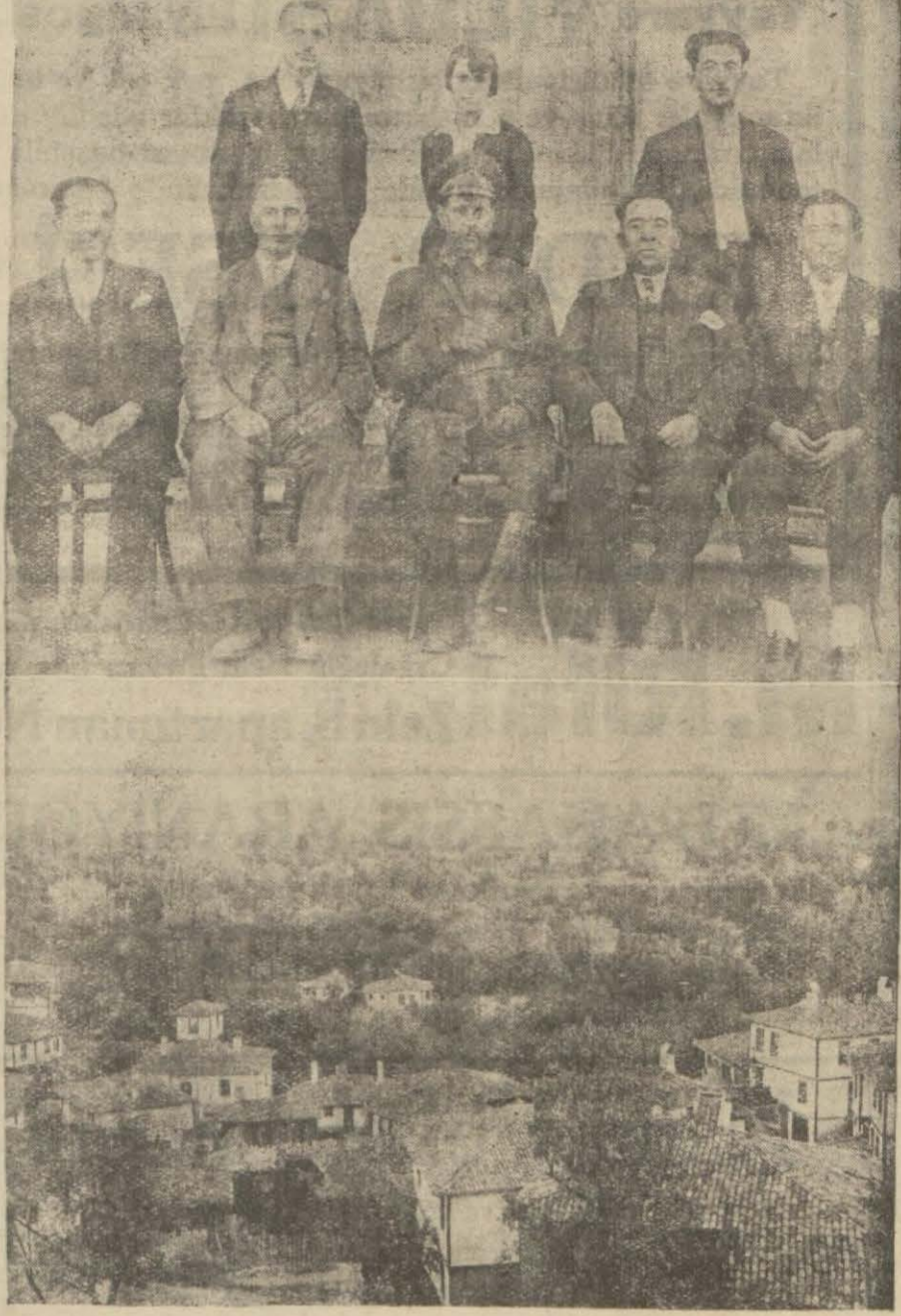
Yukarıda: Boyabat Himayeî etfal ve mektep himaye heyeti, aşağıda Boyabattan bir manzara

Mektep binaları, muallimlerin intizamperverliğine rağmen tamire muhtaçtır