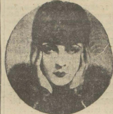
Liya de Putti

MACAR sinema yıldızı Liya de Putti, devamlı bir kan zehir-lenmesinden mütevellit zatürriye neticesi olarak vefat etmiştir.