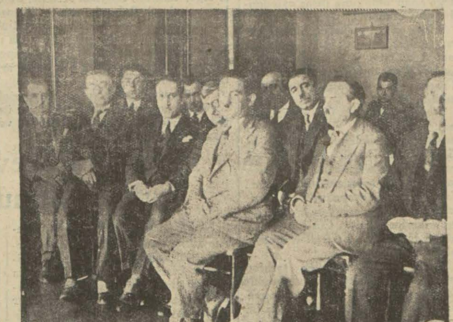
Doktorların dünkü içtimalarında aldıkları bir resim

Doktorlar dünkü içtimalarında kazalarda seri yardımlarda bulunmak üzere "imdadı sıhhi" merkezleri ihdasını istediler