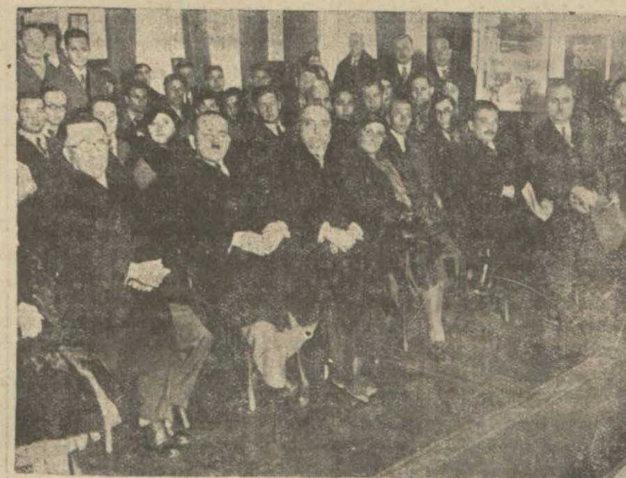
İçki aleyhtarlarının dünkü içtiması

"Yeşilhilâl," isminin "içki aleyhtarları cemiyeti," ne tahvil edilmesi hakkındaki teklif kabul edildi