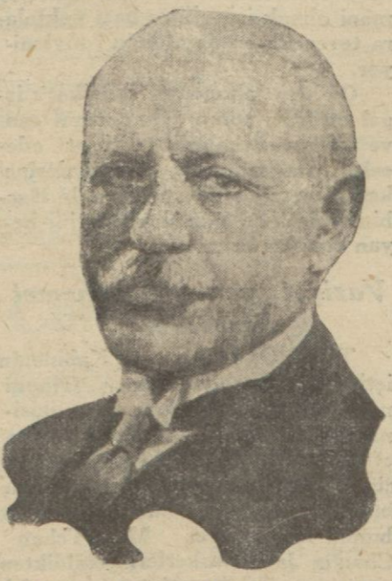
Bulgar Başvekili M. Muşanof.

Sofyadaki Fransız ve Yugoslav sefirleri Başvekili görerek, İtalya ve Rusyanın müzaheretile, Yunanistan, Bulgaristan ve Türkiye arasında bir ittifakı müesses aktedilmekte olduğundan endişe ettiklerini bildirdiler. Fakat M. Muşanof bu endişeleri izaletmiştir. Ve Bulgaristanın komşularile hüsnü münasebet arzusunda bulunduğunu kendilerine izaletmiştir. Ziyareti, Tevfik Rüştü Beyin geçen ilkbaharda Sofyaya