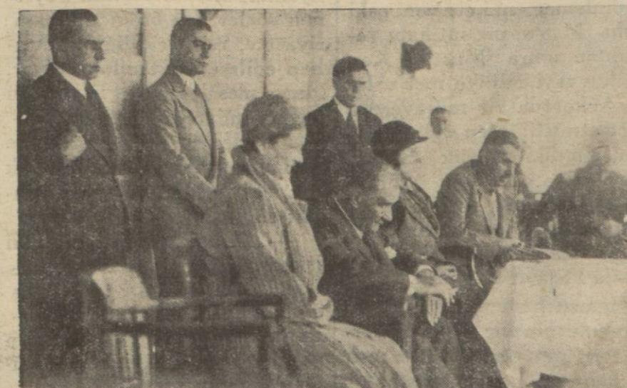
Reiscümhur Gazi Mustafa Kemal Hz. Meclis Reisi Kâzım Paşa Hz. ile birlikte Ankara'da yapılan görüş birinciliklerini seyreliyorlar

Bugün başladık. 2 ncı sahifemizde okuyunuz..