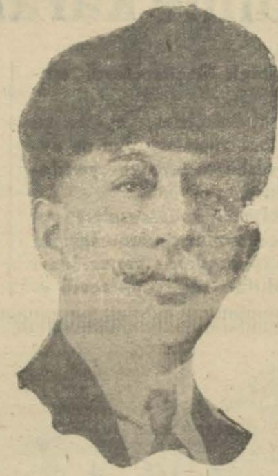
Bekir Sami Bey

Orada bizimle muarız bir sa- ray ve bir Osmanlı hükümeti var. Yanlarında ise istilâcî düşmanlar mevcut şu halde Anadolunun bir köşesinde toplanıp davamızı yürütmek daha salim, daha emin, daha doğru olur. İstanbul cazibeli, yumuşaklığı bir yerdur. Burada felâketi görerek koşan arka- daşlar korkarım ki Marmara- nın mavi kıyısında yumuşama- sınlar.