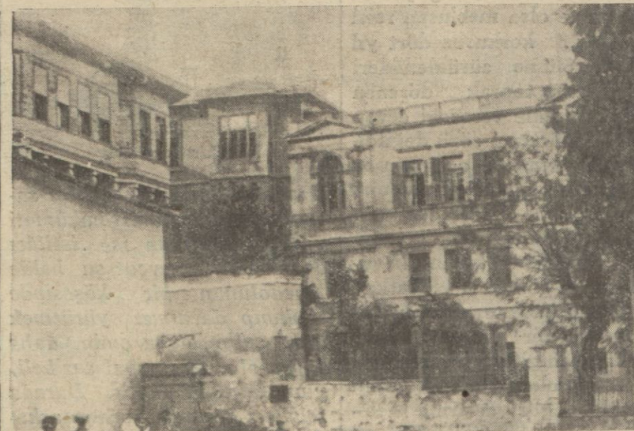
Fener Rum başpapaslığına bir nazar..

Stadyom hakkında spor teşkilâtımızın muhtelif kısımlarına mensup bazı arkadaşlarımız (Sporcular namına) beyanatta buldukları görülmektedir. İstanbul spor işlerini birinci derecede alâkadar olan T.İ.C.İ. İstanbul mmtakası hey'eti merkeziyesi intihabını takip eden ilk içtimada stadyomun Yeni bahçede yapılmasını muvafik olacağına karar vermiş ve bellediye riyasetine de müracaatta bulunmuş olduğundan hey'e timizden gayri vukubulacak beyanatın şahsî telâkki edilmesi lâzım geleceği görülen lüzum üzerine tasrih olunur.