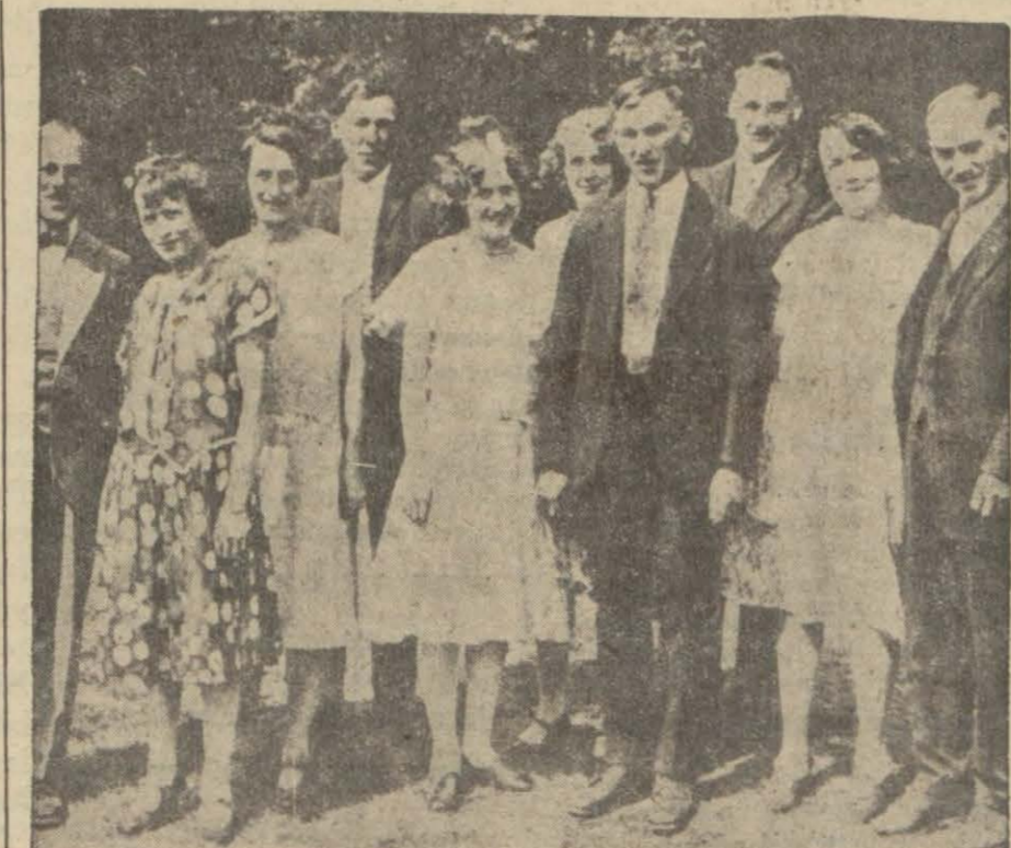
Amerikada bir ailenin beş erkek çocuğu, diğer bir ailenin beş kıızı ile evlenmişlerdir. Aynı zamanda kardeş ve bacanak, hemşire ve eli olan bu aile gayet me'sut yaşamaktadırlar. Birbirlerine amca zade olan on altı çocukları vardır