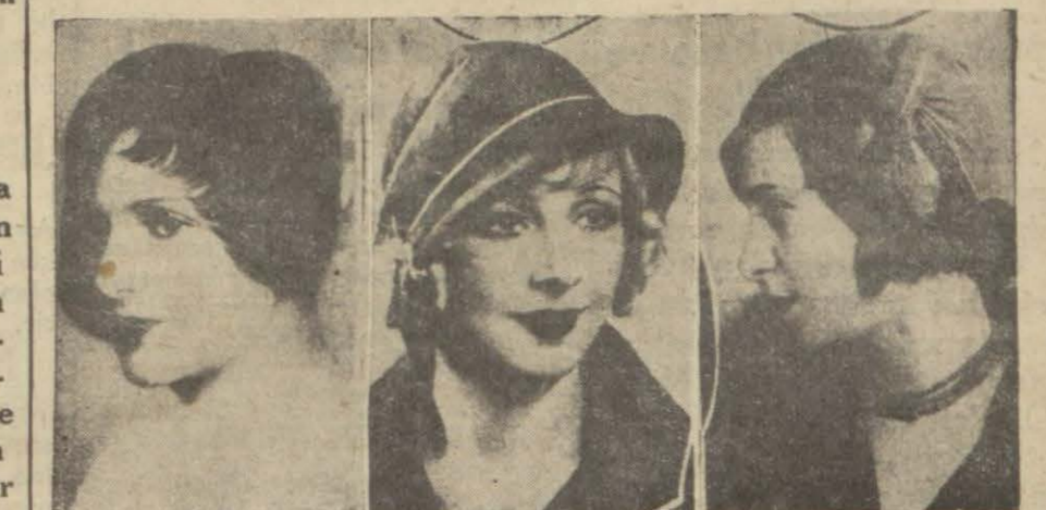
Kışlık yeni şapka modelleri

Marco Polo bir müddet sonra vilâyetlerden birine vali tayin edildi. Daima beraberinde bulunan babası ve amcası onun bu Çin memleketinde daha ziyade yükselmesini arzu ediyorlardı. Marco Polo valilikten sonra Hindistana sefir tayin edildi.